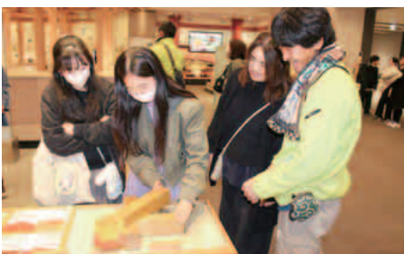
技術の高さに脱帽