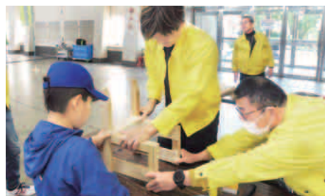
大工さんと協力して椅子づくり

十一月十五日(土)・十 六日(日)の二日間、千種 区の吹上ホールにて愛知県 技能士会連合会主催の「あ いち技能プラザ2025」 が開催されました。