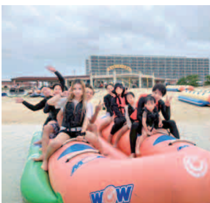
海の乗り物で大はしゃぎ