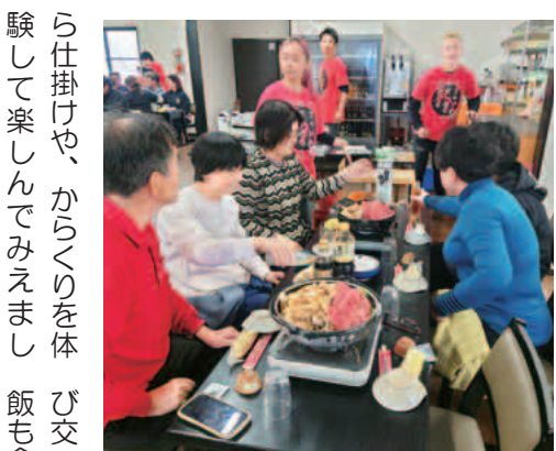
いっぱい食べるぞ～