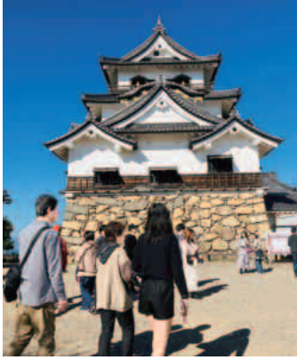
青空のもとでの彦根城

十一月十六日(日)一宮支部では、秋の支部レク「国宝・彦根城散策&近江八幡水郷めぐり」に参加者五十四名バス二台で行って来ました。