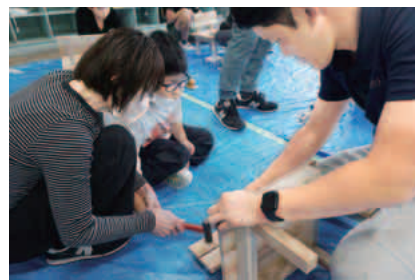
みんなで一緒に木製椅子作り

十月十四日、名古屋市立 上野小学校で木工教室を行 いました。参加したのは特 別支援学級の児童九名で す。 材料の搬入、準備をして いる時から興味津々の児童 達で、予定時刻より前倒し のスタートとなりました。 はじめに、挨拶と自己紹 介から始まり、続いて木の