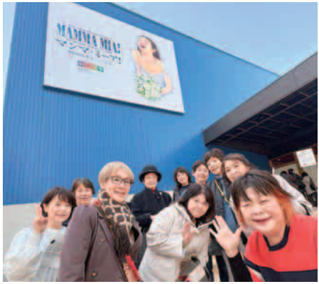
劇場前で記念撮影

十一月三十日(日)に、ソノマリアへ、参加人数劇団四季ミュージカル「ママンマミーア」へ、参加人数十三人で観劇に行ってきた。