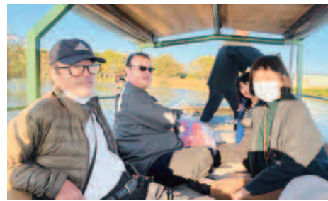
水郷めぐりで記念撮影

策の旅に出掛けました。まずは平城京跡歴史公園へ。荘厳な朱雀門の向こうに太極殿を見ることができ、奈良時代の情景を思い浮かべながら平城宮いざない館へ。