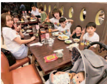
家族で沖縄料理を堪能