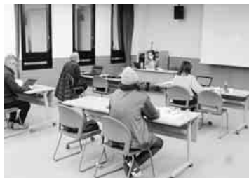
前回のパソコン講習会の様子