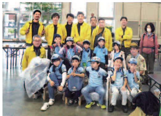
参加者と仲良く記念撮影

ことが嬉しかったです。児 童達が積極的に取り組んで くれたおかげで、とても順 調に進みました。 その後、鋸で丸太を切る 体験、鉋で角材を削る体 験、継手・仕口の模型体験 もしてもらいました。 最後に、児童達から感想 の発表がありました。