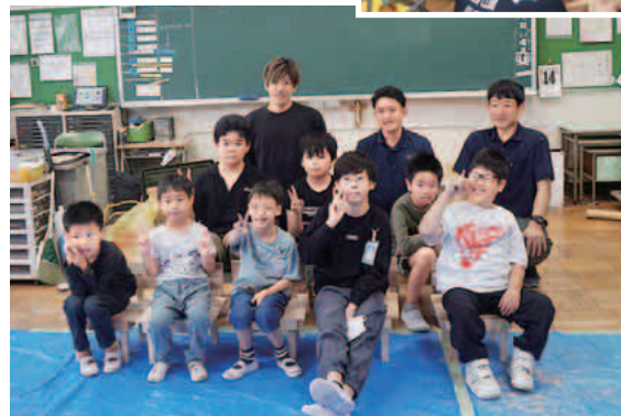
児童たちと記念撮影