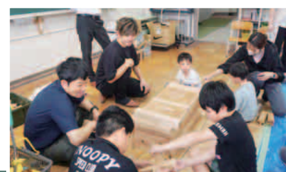
継手・仕口の 模型体験

嬉しい言葉をもら い、また、大工さん に興味も持ってもら えて、有意義な時間 になったと感じまし た。 帰る際には握手を 求められ、大工を