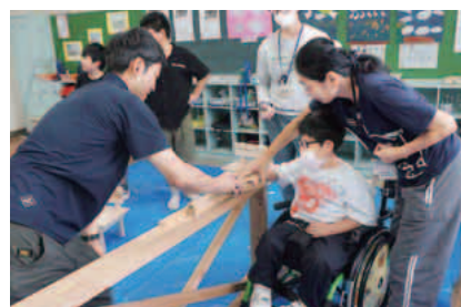
鉋削りできるかな～

業・団体ばかりです。 技術対策部は住宅対策部 の協力のもと木製(杉)の 椅子づくり体験を行いました が、二日間で百人以上の 子供たちが参加し、会場に は玄能の「トントン、トン トン」という音が響き渡り