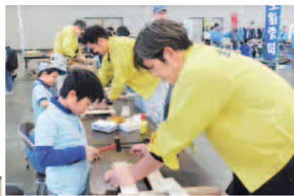
上手にできるかな～

家作りの勉強を行いました。 そして、いよいよ釘打ち 体験の木製椅子作りを行 いました。釘を楽しく打 つ姿や、少しずつ形になっ ていく作品を純粋に喜んで いる姿がとても新鮮で印象 に残っています。ものづく りの楽しさを共有している