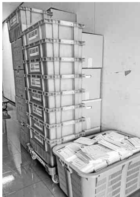
厚生労働省に届いた多くの要請ハガキ

等、各運動を進めてきた結果が国保組合の現行補助水準確保の見通しに繋がりました。改めて感謝申し上げます。 今後、全国の仲間と共に予算要求運動に全力で取り組んでいきますので、引き続きご協力よろしくお願いいたします。