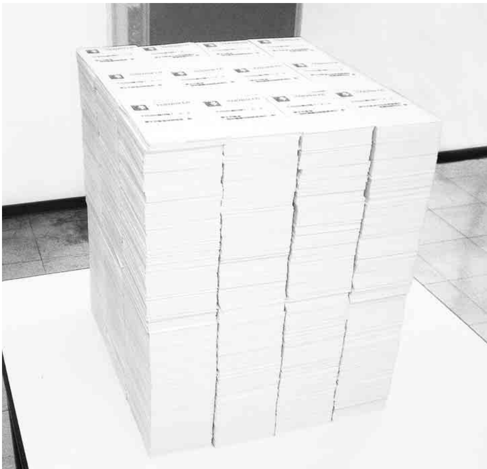
皆さんから寄せられた要請ハガキ

新たな目標「めざせ！二〇〇〇人の組合」に向け、引き続き組織拡大行動にご理解ご協力をお願いいたします。