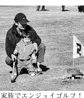
家族でエンジョイゴルフ!

本日も快晴!と思いきや風が冷たい!寒い!こんな寒い中、川沿いでゴルフなんてと津島支部はグラントゴルフを開催した。総勢四十名若男女問わず賑やかな参加。家族同様なご夫婦のみ、男子二人組、最高年齢参加者はなんと八十八歳!