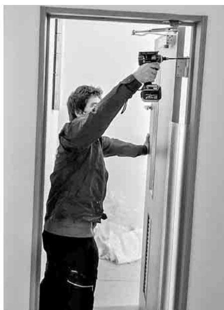
服部幹事 作業の様子