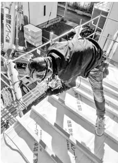
林幹事 作業の様子