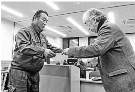
表彰状を受け取る一宮支部/山口副支部長