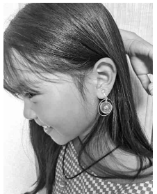
かわいいアクセサリができました

最終和やかな雰囲気でも楽しかったです。京都の街並みの魅力と伝統芸能、吉本新喜劇など歴史を感じると共に、現代の京都の観光地としての魅力を感じ