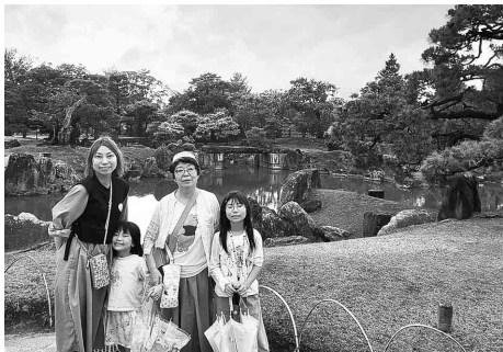
日本庭園前で家族揃って記念撮影

最終和やかな雰囲気でも楽しかったです。京都の街並みの魅力と伝統芸能、吉本新喜劇など歴史を感じると共に、現代の京都の観光地としての魅力を感じ