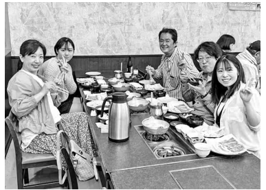
おいしい昼食に大満足!