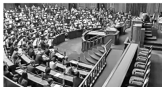
参議院本会議で全会一致で採択

請願署名の集約数は119万6,248筆(受理数111万9,000筆)で、衆議院は60万1,314筆(同55万7,975筆)、参議院は59万4,934筆(同56万1,025筆)。賛同署名については、9政党と無所属で368人(紹介議員は310人)で、衆院議員