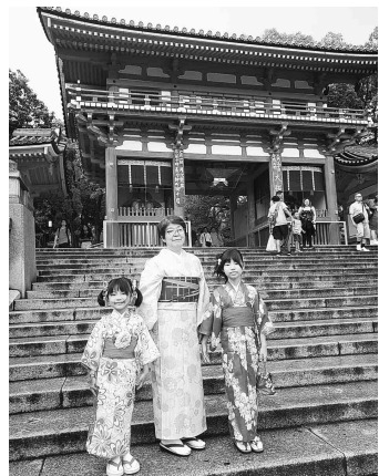
涼しげな浴衣姿で記念撮影

最終和やかな雰囲気でも楽しかったです。京都の街並みの魅力と伝統芸能、吉本新喜劇など歴史を感じると共に、現代の京都の観光地としての魅力を感じ