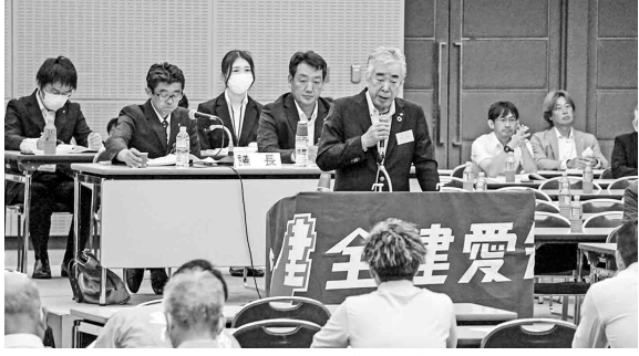
第52回定期大会の様子

建設技能者の処遇改善や担い手確保・育成、社会保険加入対策、働き方改革など建設産業政策が、CCUSを軸に着実に進められており、国土交通省が「不撤退の決意を進める」と表明し、大臣告示にも「建設技能者とはCCUSに登録された者をいう」と明記されています。登録者は百四十万人を突破し、建設技能者の約二人に一人が登録して