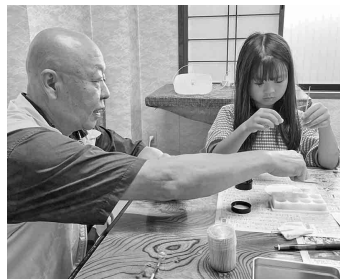
どんなアクセサリができるかな～

指導する講師が悪かったせいか? なかなかうまくいかなくて、何度も作り直しました。そんなこんなでなんとか形になりました。講師は「失敗作も体験の