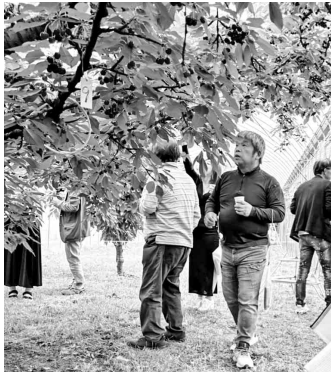
どのさくらんぼにしようかな～

した後は、風食会場のピアンテさくら亭へ。お肉を目の前にすると皆様はくばくと。追加で馬肉を注文する方も多くいました(これも安心)。