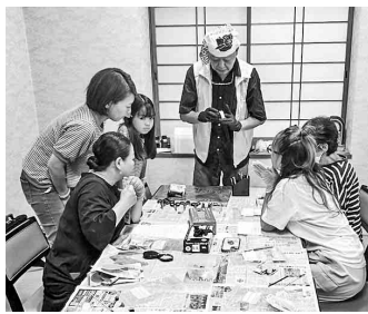
熱心に説明する講師

今回は「体験」ということもあって最初に危険性についてのお話をしました。レジン液とUVライトが危険であると知っていたので、安全に作業をすることに約束しました。