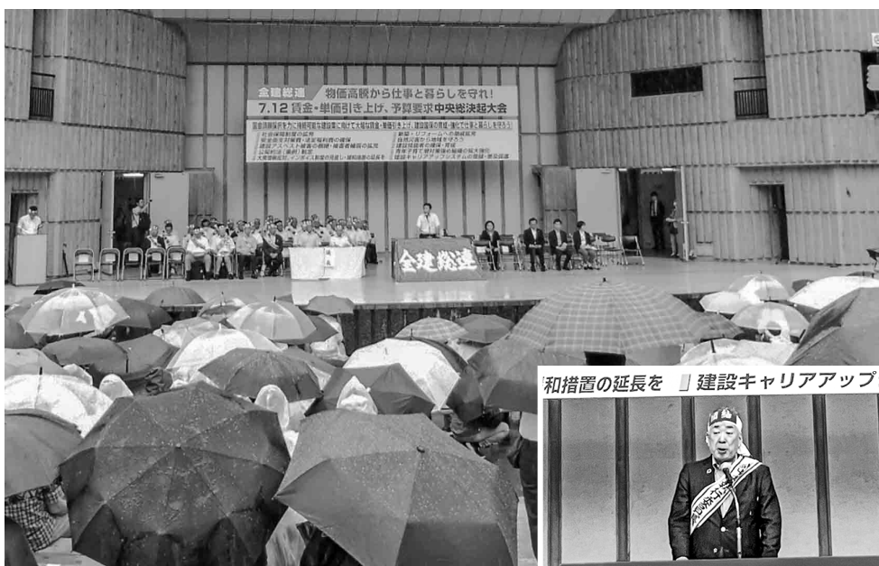
雨の中参加した全国の多くの仲間