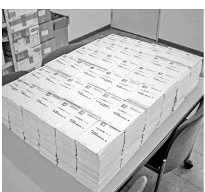
集約された28,521枚の要請ハガキ

この間、ご協力をいただきました全ての皆さんに、深く敬意を表すると共に心から感謝を申し上げます。