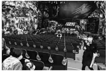
開演まで待ち遠しい

人間界と化物界が行き交う世界のミュージカルの舞台の始まりです。ステージに猫に扮した役者達が客席通路を走り猫達。歌に踊る音楽とドラマの展開に興奮です。軽い