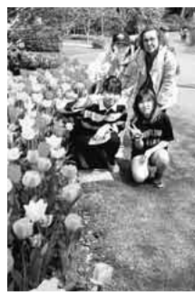
満開のチューリップ

最初は、浜名湖花博に行きました。ちょうど当日は来場者十万人を突破したという事でセシモニーが行われた。