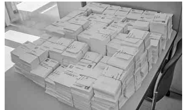
昨年秋、皆さんにお書きいただいたハガキ

厚生労働省では、皆さんにお書きいただいた全ての要請ハガキに目を通しています。印刷やコピー、要請書としてふさわしくない内容、建設業と関わりのない職種が記載されているハガキは全建連に返されています。要請ハガキは、必ず手書きでポストへ入れずに支部の役員へお渡しください。