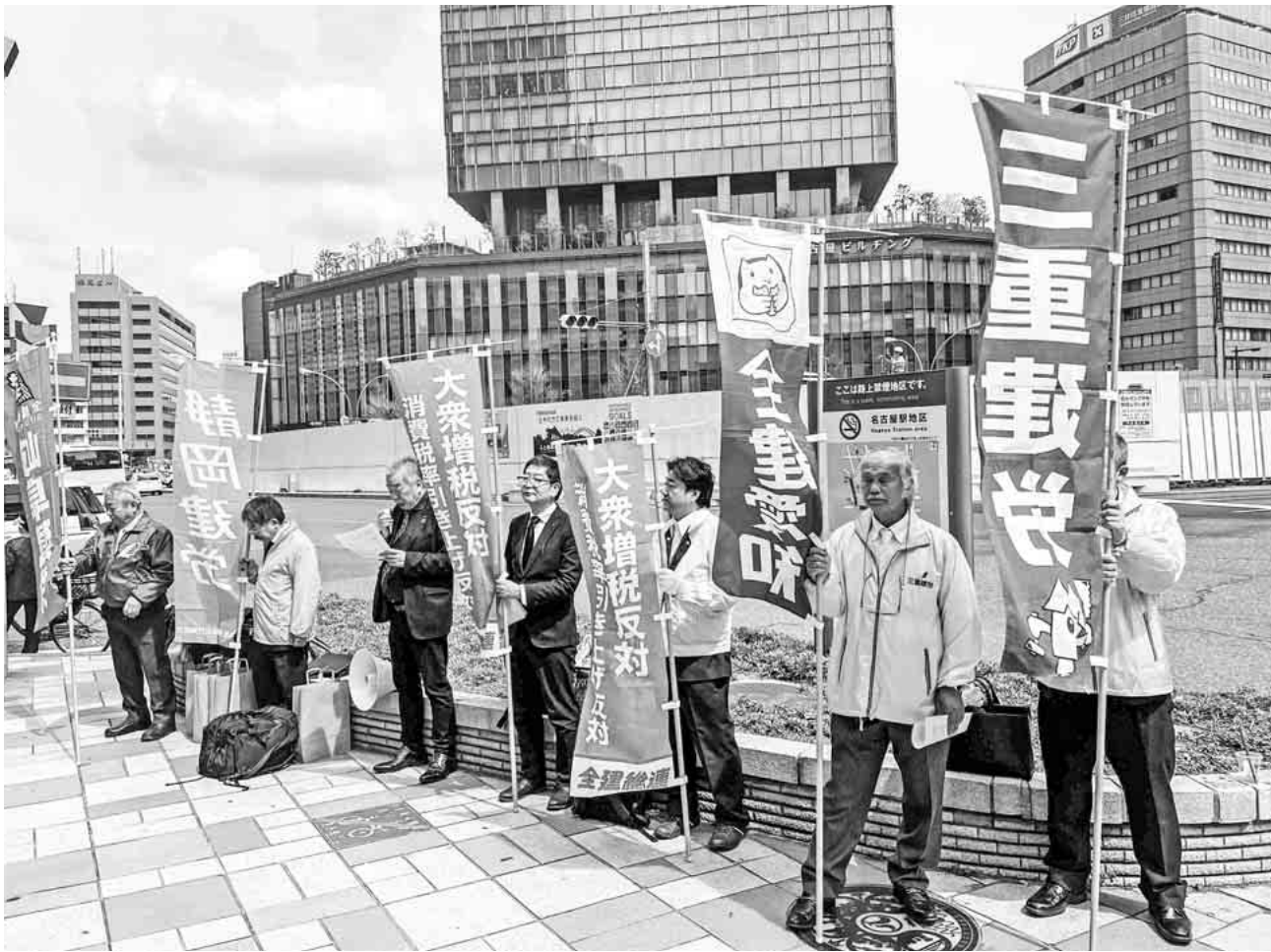
増税反対を訴える役員

全建愛知 全愛知建設労働組合 〒455-0008 愛知県名古屋市港区九番町4-1-10 電話 (052)659-0288 FAX (052)653-0181 0120-154-931 050-3785-1684 E-mail: honbu@zenken-aichi.com