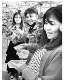
美味しいイチゴを堪能

お昼の会席料理の後、花の舞酒造へ行きました。酒造の社長さんのご厚意により、大吟醸酒からフルーティーなお酒まで惜しみなく味わう事ができました。皆、大満足でした。おみやげにガラスのおちよこをいただきました。