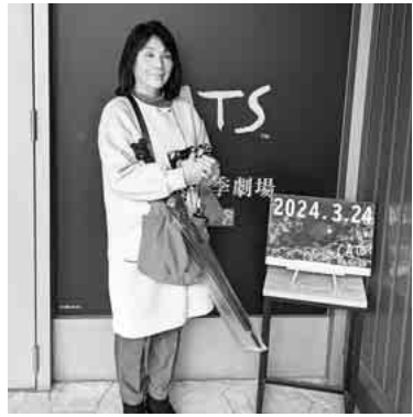
キャッツの世界へ

客席への扉を開けた時からそれは始まっていた。三月二十四日(日)待ちに待ったこの日がやってきた。旭瀬戸支部初めての試みの観劇。参加者八十名の方々と