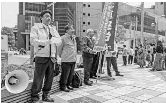
名駅前での多くの通行人へ向けて実施

新型コロナウイルス感染症の五類移行後、五年ぶりの実施となり、拡声器を使った街頭演説活動も同時に、インボイス制度について、特別措置の延長を求めています。皆さん、ともに反対の声をあげていきましょう。」と訴えかけました。