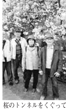
桜のトンネルをくぐって

鳴き声が聞こえてきました。桜にうぐいす...も、いいものです。チューリップの花も満開でとてもきれいでし