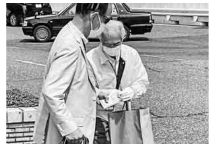
ティッシュを手渡ししながら呼びかけ

東海地協をはじめ、全国各地で、消費税増税を中心とした、さらなる大衆増税に反対をしています。同時に、インボイス制度については内容の見直しと、特別措置の延長を求めています。皆さん、ともに反対の声をあげていきましょう。」と訴えかけました。