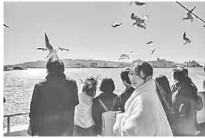
カモメのお出迎え

「雲丹、いくら」の高級食材もあり、お腹がはち切れそうです。ここで一息ついたところでしたが、「清水港バイクルーズ」大量のカモメにお出迎えをいただきました。