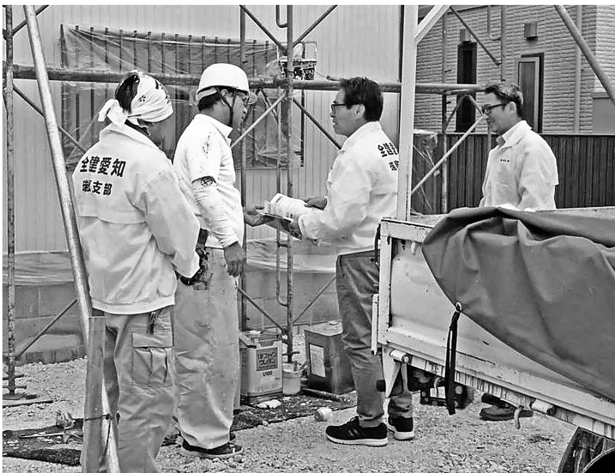
現場へ訪問し組合の説明をする瑞穂支部役員 (2019年10月17日実施)