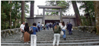
お参りしましょう

十月二十七日(日)総勢九十人の組合員及び家族で、伊勢方面へのバス旅行に行っていました。