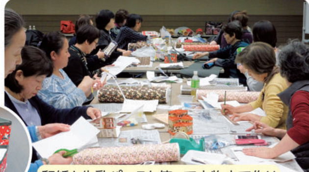
和紙と牛乳パックを使って小物立て作り