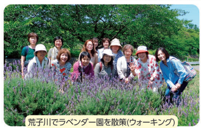
荒子川でラベンダー園を散策(ウォーキング)