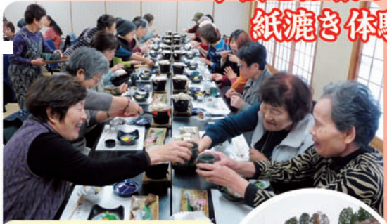
小原の地元料理を堪能 (じねんじょ・あまご)