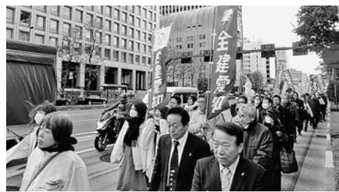
デモ行進をする中川熱田支部の皆さん

【位田主婦の会会長 記】 次は、春と秋の二回、白やピンクの可憐な花を咲かす川見四季桜の里へ向かいました。赤く色付いたモミジとのコラボレーションを「わあ、きれい」とカメラにおさめていました。 昼食後は、外国人観光客も多い香風溪へ。巴川のせせらぎを聞きながら四千本の見頃の紅葉を左右に見ながらの散策。人気スポーツの巴橋、待月橋も秋に彩られしっとり。食べ歩きを楽しむ人もいました。 今回「初めて香風溪に行くのよ」という人が多く、深まる秋をしっかりと楽しむことができました。渋滞もせず、「またね」と夕日を背に散会しました。