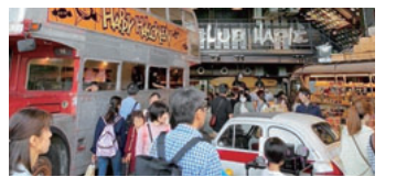
お土産屋さんにはスゴイ人

まず案内されたのは、一八四二年に建てられた忍者屋敷です。それも違う場所に建てられたものを解体し移築したそうで、内部には「どんでん返し」や「隠し通路」など当時の様子をス