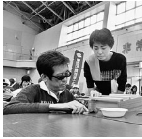
お父さんが応援する様子

十一月九日(土)～十日(日)の二日間に渡り、吹上ホールで「あいち技能プラザ2019」が開催されました。