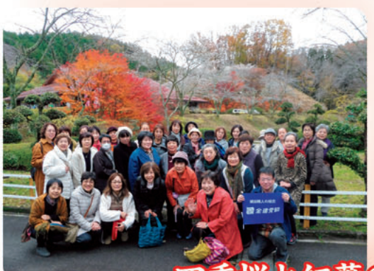
四季桜と紅葉の鑑賞と紙漉き体験 香嵐渓の紅葉にうっとり