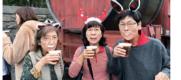
ビールをいただいています