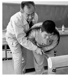
ヨイショヨイショ

最後にインテリア棚を各部員の指導のもと作ることができ、みんなとても満足そうでした。付き添いの先生も含めて木工教室に参加した子どもたち全員が、「とても楽しかった」と感想を口にしました。