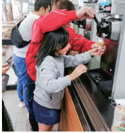
ソフトクリーム巻きしています

ここではソフトクリーム作りの体験をしました。長野で作られたリンゴのソフトクリームとすずらん牛乳のソフトクリームの二種類から選んで体験することができ、これがなかなか