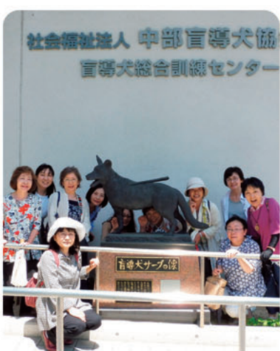
中部盲導犬協会の見学