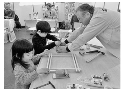
頑張って作業しています

色紙台は八個の部材を並べて釘打ちしますが、打ち方が悪いと曲がってしまいます。ここで私たち役員の出番です。釘を打ってあげ