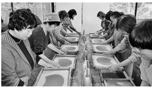
紙漉き作業中です

2人の嫁いだ娘夫婦が帰省するので、毎年、お正月は大変賑やかです。おせち料理など腕を振るって出迎えます。