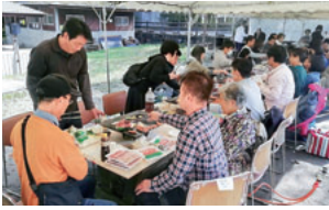
お昼は楽しくバーベキュー

十月二十七日(日)午前八時より総勢五十二人、バス二台で駒ヶ根のキャンプ場へ行ってきました。