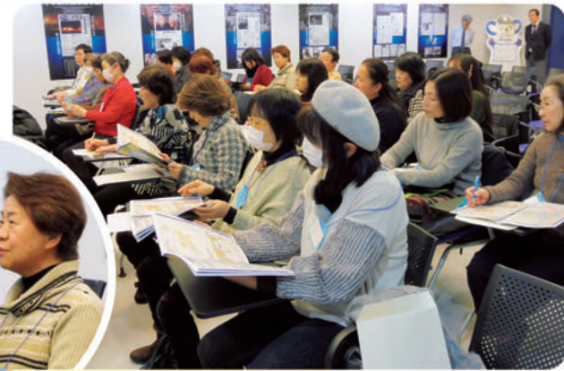
新聞作りを見学(中日新聞社)