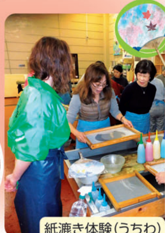
紙漉き体験(うちわ)