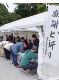
組合員も御記帳していました

十月二十七日(日)総勢九十人の組合員及び家族で、伊勢方面へのバス旅行に行っていました。