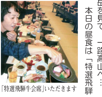
「特選飛騨牛会席」いただきます

伊勢神宮内宮宇治橋前では、天皇陛下御即位を奉祝し祈りの記帳所が開設されており組合員