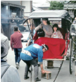
人力車に乗って町並みを見学

十一月三日(日)、支那の山の日帰りの旅行「高山と白川郷の散策」に行っていました。