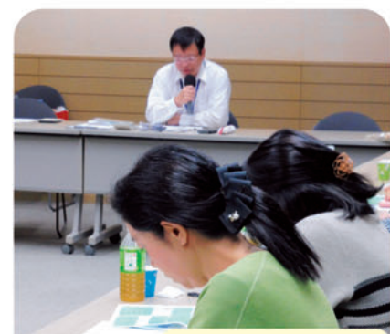
活動家育成学習会 (主婦の会コース)