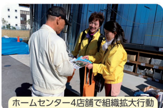
ホームセンター4店舗で組織拡大行動 (建デポ清須店にて)