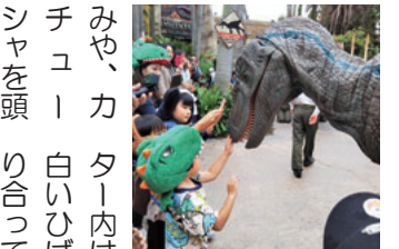
可愛い恐竜をナデナデ