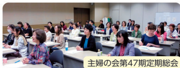
主婦の会第47期定期総会