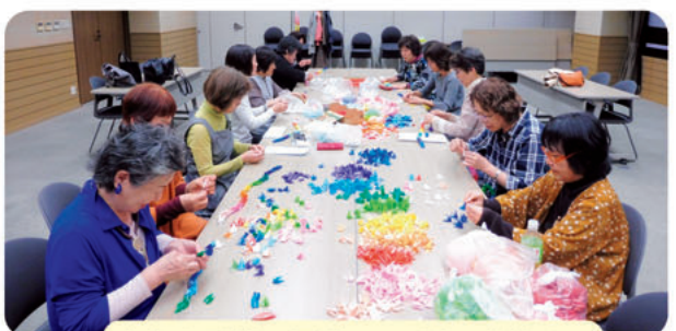
広島と長崎へ平和への願いを込めて