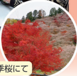
川見小原四季桜にて