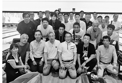
全建愛知と中建労の皆さん