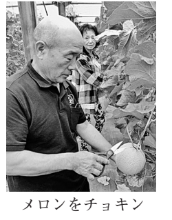
メロンをチョコキン

や美味しい食べ方の説明を受け、お持ち帰りのメロン二個を真剣な顔つきで選んでいました。