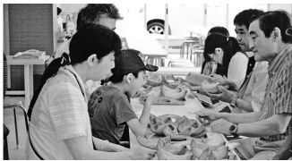
伊良湖メロン狩り

六月二十三日(日)曇りのち雨と予報される薄曇りの中、各級議員さんの見送りを受け、メロン食べ放題の旅、伊良湖へ向け出発。早々ガイドさんから天気は皆さんの気合の入れ方次第で良くなると聞き早速「気合だ」と一声、しかし三回はダメですといわれ皆大笑い。その効き目が最後まで雨にも降られず天候に恵まれました。