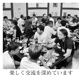
楽しく交流を深めています

【丹羽則文通信員】 ※中建労：正式名称は、中部日本建設労働組合といい、瀬戸市上水野町に組合事務所があります。全建愛知とは友好団体になり、健康保険では、中建設愛知支部の瀬戸出張所として加入しています。