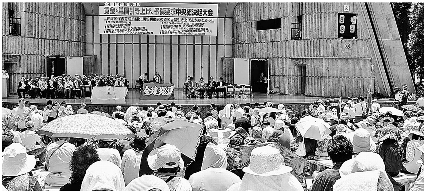
全国から49県連・組合 3,019人が集結