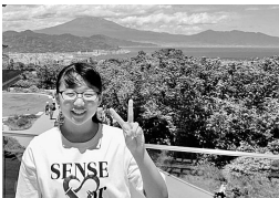
富士山をバックに記念撮影

六月十六日(日)、鶴舞図書館前に集合した参加者三十八人は、高鳴る胸を抑えながら、バス一台に乗り込み富士山へと向かいました。