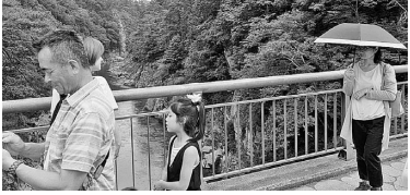
天竜峡をウォーキング

六月二十三日(日)、港支部は「南信州さくらんぼ狩り」天竜峡ウォーキングを行いました。高森サンファームのさくらんぼは、大きくやわらかでとっても甘く、最高に美味しかったです。