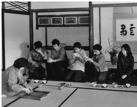
旧近衛邸内にて抹茶で一服

一月十八日(水)、中村支部主婦の会の新年会が、千種区山門町にある料亭「松楓閣」で、参加者十七名で開催されました。玄関に入り、おもてなし