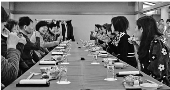
楽しくうちとけて、美味しい食事

「いつもめずらしい処へ連れて行ってくださって嬉しい」組合に入っていてよかったね「次の集いが楽しみです」今年も元気で...」等、明るい会話で各自家路につきました。【内藤美佐子通信員】