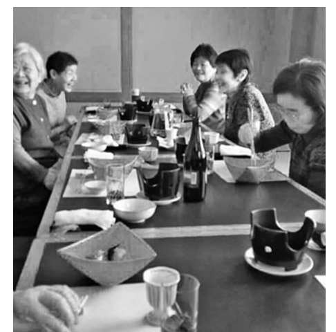
楽しいおしゃべりタイム

食、歓談、表彰式。贈られた賞品を見せ合ったり、交換されたりしてました。来年も楽しく参加して楽しきましょう。役員さんお疲れ様でした。【中井康二通信員】