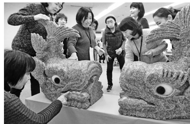
お札がシャチホコに変身

お札の偽造防止技術は、すかし技術はもちろんパーリンキや目の不自由な人のための凸凹インキ、マイクロ文字など様々な工夫がされています。参加者はこすったりフラックライトを当てたり、ルーペを覗いたり、しっかりと自分の財布の中に偽札はないか真剣に確認をしていました。