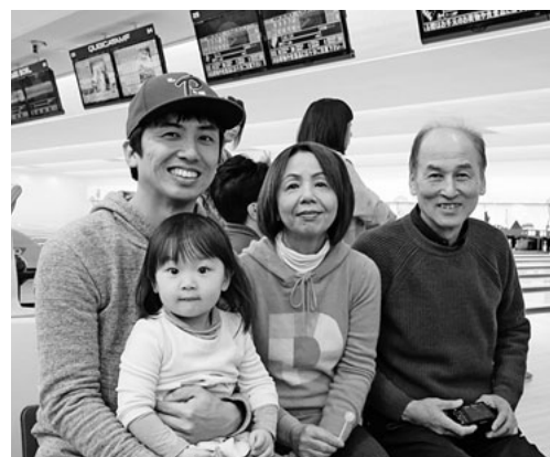
頑張って優勝するぞ