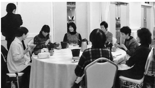
おいしい食事で幸せいっぱい

今回の旅行は新しい方も参加して、バスの中では賑やかで楽しい会話がはずみました。途中三河の小京都と言われる、西尾市の歴史公園へ立ち寄り、園へ立ち寄り、そこには京都の旧近衛邸内にあった数寄屋造りの書院と茶室が移築されてあり、名産であるお抹茶を頂き、一路リンクスへ。リンクスでは、三河湾の素晴らしい景色