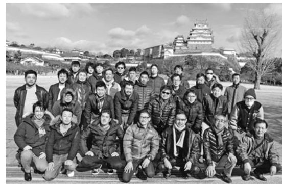
国宝姫路城をバックに

2日目は世界文化遺産の姫路城を見学しました。ここでも、ガイドの方の説明を聞きながら見学をしました。大規模な修繕をされた後でしたので「白い」姫路城でした。ガイドの方の説明がとても判りやすく、ただ見るだけでは無く、歴史的背景を知ると更に面白く、何故この城の造りにしたのかなど理解することができました。