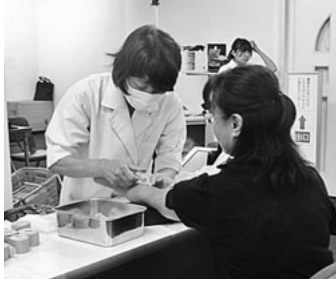
集団健康診断の様子

私たち建設職人は体が資本です。健康管理の第一歩は、定期的な健康診断から始まります。ご自分の大切な体です。早期発見・早期治療のためにも、年に一度は必ず健康診断を受けましょう。