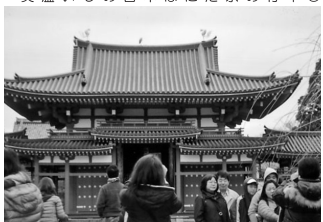
鳳凰とサギと記念撮影

二月五日(日)守山支部は六十七名で初詣に行きました。傘の花が咲く中「京都伏見稲荷」たくさんの絵馬にお願いがいっぱい。朱色の千本鳥居を進み古(いにしえ)の祈りの心を感じました。冷たい雨も、参道の温かい飲み物で笑顔になります。