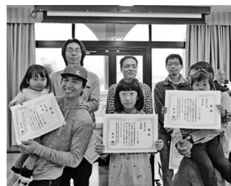
今回の上位成績者

り、交換されたりしてました。来年も楽しく参加して楽しきましょう。役員さんお疲れ様でした。【中井康二通信員】