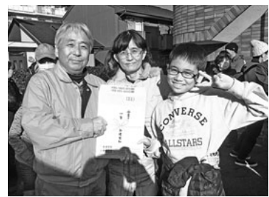
温泉一泊旅行を獲得

駐車場の餅つきコーナーでは、青年部幹事が威勢良く杵を振りおろし、元気なちびっ子も負けじと続きま