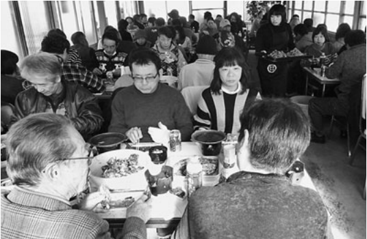
揚げたてが次々とテーブルに

五十個食べる方が多いと言われる中八十個以上食べた強者も。一方海鮮は鯛の頭付き舟盛りと伊勢海老も出て大満足だったように車内で