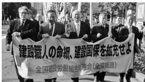
シュプレヒコールで訴え東京駅まで行進(中央総決起大会)

社会保険関係費における高齢化に伴う自然増の抑制をはかる計画の二年目において、政府二〇一七年度予算策定に関して厳しい査定が見込まれる情勢の中、高額医療費共同事業補助金をはじめとした裁量的経費一