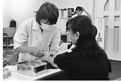
集団健康診断の様子

※受診希望日の2週間前までに、「契約健診施設」へ直接電話予約をしてください。 ※エルスメディケア名古屋は、女性専用の健康診断施設になります。ご注意ください。 ※契約健診機関で受診され、アスベスト読影をご希望される方は、レントゲンフィルムを組合までご提出ください。 ※だいたいクリニックにつきましては平成29年3月末日までの契約となりますのでご注意ください。