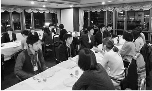
前回は1組のカップルが誕生!!

青年部主催婚活パーティーのご案内になります。今年度は既に2回を開催し、合計5組のカップルが誕生しています。