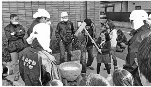
たくさんの方が餅つきに挑戦

十二月十一日(日)、『餅つき大会』を全建愛知会館で開催しました。当日は暖かく、日も当たり、過ごしやす