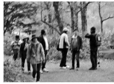
おいしい空気をいっぱい吸って