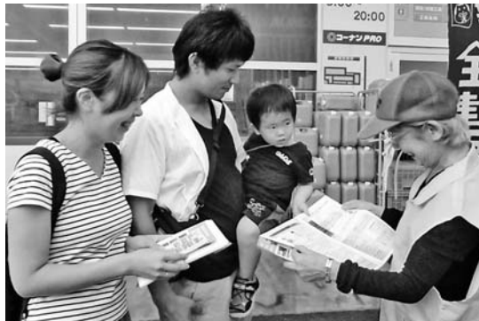
若い家族に声をかける

9月18日(日)、一宮支部はホームセンターコーナー宮プロで拡大行動を行いました。主婦の会2名含めて5名の参加です。あいにくの雨の中でしたが、以前この日のために購入したテントが大活躍。