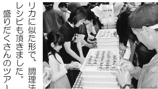
つめ放題にみな真剣

お天気もすこく良く、バスからの車窓の景色も楽しみなが、まず道の駅とよみで野菜のつめ放題をしました。珍しい野菜のはやとつり、