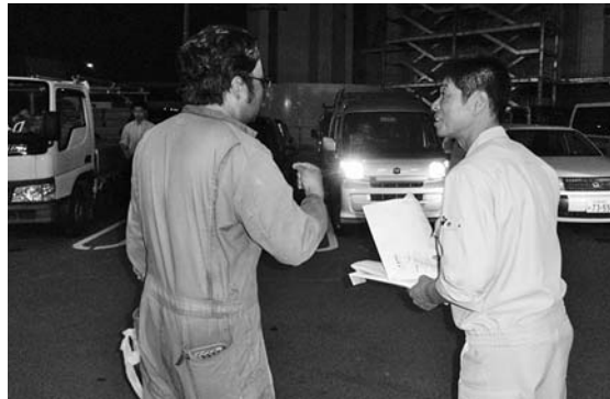
イオン建設で職人が集中

9月15日(木)、長久手ロイヤルホームセンター駐車場にて行いました。この場所の隣にはイオンの工事現場があり、この仕事帰りの職人さんと今まで通りの建築資材購入客をターゲットに夕方6時から行いました。