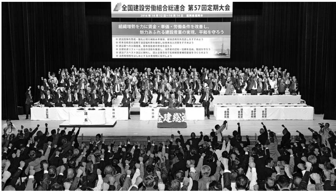
53県連・組合1,631名の仲間が集結 団結ガンパロー

「組織増勢を力に賃金・単価・労働条件を改善し、魅力あふれる建設産業の実現、平和を守ろう」をメインスローガンに掲げた全建総連第五十七回定期大会が、十月十二日(水)～十四日(金)、福岡サンパレスホテル&ホール(福岡県福岡市)で開催され、五十三県連・組合千六百三十一名(全建愛知からは十九名)が参加しました。