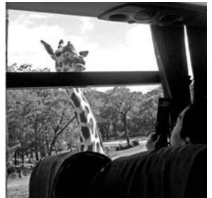
高いところから覗き込むキリン

にもかかわらず集まった人数は二十二人。「見てごらん。色んな人間がいるぞ」「いやー、見学しすぎて一休み」とライオン君。「人間のおやつ