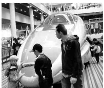
500系が一番かっこいい

十月二十三日(日)、昭利支部主婦の会主催で、五十五名の組合員さんご家族と「京都鉄道博物館と伏見稲荷」に行きました。行きに「がん予防、メタ