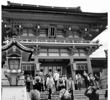
桜門をこえて千本鳥居へ