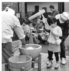
昨年の餅つきの様子

毎年恒例の「餅つき大会」を開催します。全建愛知が組合員の皆さんにより身近な存在に感じていただけるように、「餅つき・ぜんざい・フランクフルト・スーパーボールすくい・壁塗り体験・丸太切り・重機の展示・慈善バザー・豚汁・折り紙教室」など、皆さんの楽しい催しを企画しています。また、今年も組合員を対象にした