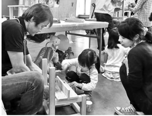
もうすぐ完成、もうひと頑張り

十月十四日(金)～十六日(日)、吹上ホールにてあいち住まいるフェア2016と建築総合展が開催されました。今年には住まいるフェアと建築総合展の同時開催となり一階は建築総合展、二階は住まいるフェアとなり、全建愛知では「催事・体験コーナー」として住宅相談コーナーとDIYコーナー「ミニ椅子の作成」を行い、お年寄りから家族連れの小