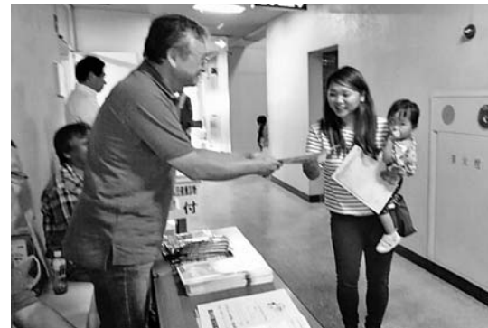
健診の受付横で声かけ

春日井支部の拡大行動が、9月11日の日曜日午前9時から市内の東部市民センターで行われました。