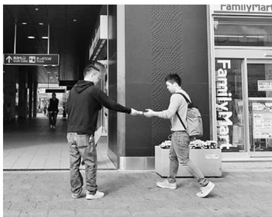
駅利用者に声かけ