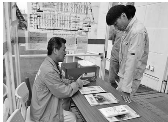
建デポ緑店の入口付近にて

10月14日(金)、緑支部の今年2回目の拡大行動を行いました。午前9時30分に緑黒石コミセンに4名集合、車1台にて出発しました。