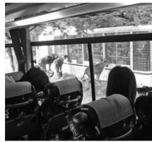
今日はどんな人間が来てるかな