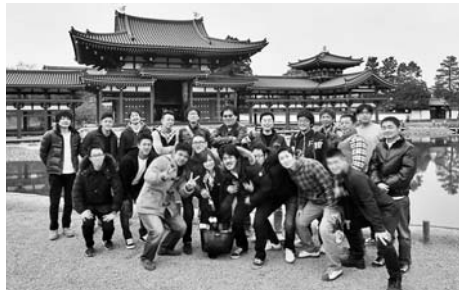
昨年の研修の様子(京都/平等院)

青年部主催の次世代幹部育成学習会を開催します。今回は竹中工館と姫路城を見学します。この機会に組合の同世代の仲間と交流しませんか。また、今回は本部青年部OBの方もご参加いただけます。是非、一度お気軽にお問合せください。ご参加を心よりお待ちしております。