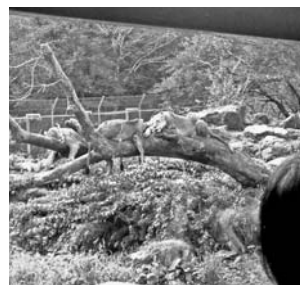
ぐっすりお昼寝中

暑い夏が終わった十月十六日(日曜日)、名古屋まつり・学校のテスト週間のせいか若者主体(後継者育成組織活性化事業)の企画