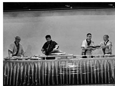
マグロの解体ショー

西支部は十月二十三日(日)に、秋レクを行いました。午前八時に数名の議員さん達に見送られ組合員及び家族八十三名が