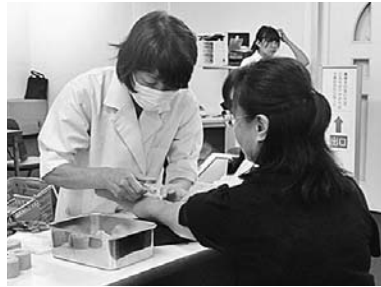
集団健康診断の様子

※受診希望日の2週間前までに、「契約健診施設」へ直接電話予約をしてください。 ※エルスメディケア名古屋は、女性専用の健康診断施設になります。ご注意ください。 ※契約健診機関で受診され、アスベスト読影をご希望される方は、レントゲンフィルムを組合までご提出ください。