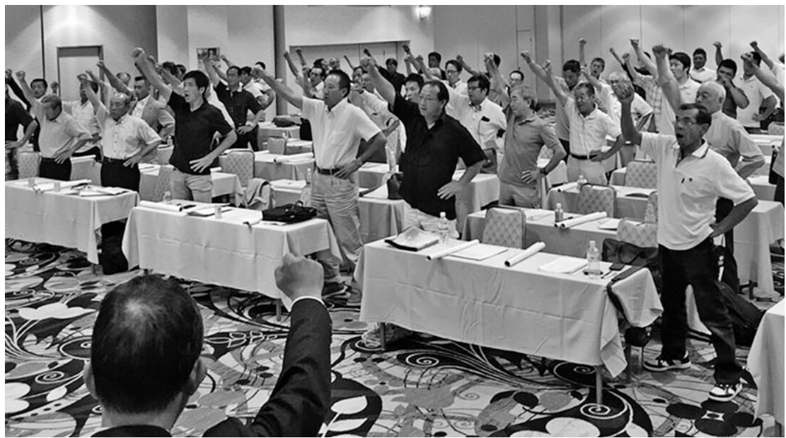
13,000人の組合目指して団結ガンバロー