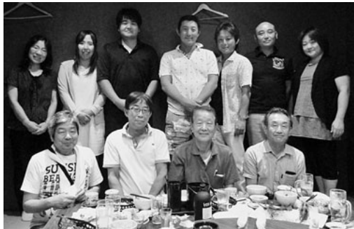
有意義な時間はあっという間

支部長挨拶後、自己紹介に始まり、徐々に打ち解けて、とび職の方は本部にも興味を示され、大工さんは仲間つくりの話、屋根さんは支部の行事の話、電気屋さんは仕事の話で盛り上がり、名刺交換等