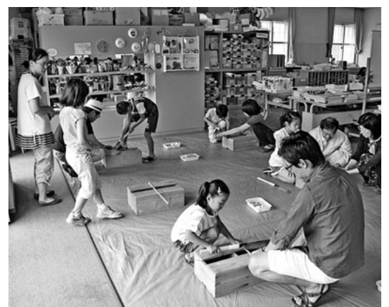
お父さん大工がサポート

りも上手なんじゃないかと思えるお父さんもいました。最後に、サンドペーパーを使って仕上げます。 完成した作品を見て喜び子供達。夏休みの宿題が出来たと喜ぶお母さん。帰る時には「ありがとうございました」と礼儀正しい子供達。「楽しい思い出が出来て良かったね」「また参加してね」と笑顔でお別れました。【尾身嘉計 記】