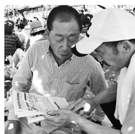
丁寧に組合をアピール

加入の仲間を紹介していただけのお願いで帰った。ぶどうの実同様、今回の活動がたわわに実ります様に。 【北原康博通信員】