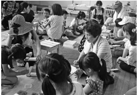
親子共同作業をやさしくサポート

去る七月三十日(火)、子・親・祖父母世代で楽しむ「第十一回三世交代交流里山体験」が千種区千石小学校体育館で開催されました。同校の児童四十名、保護者約二十名他、女性