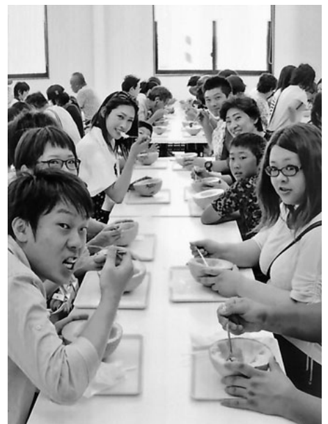
よく冷えた食べごろを試食

で盛り上がりました。その後、温泉に入り、日頃の疲れを癒しました。 最後はラグーナテンプスに寄り、たくさんのお土産を買った。 【佐藤伸吾通信員】