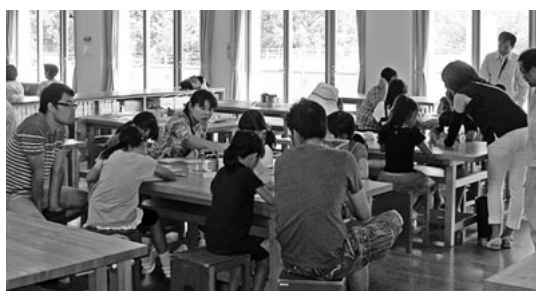
家族で楽しく真剣に