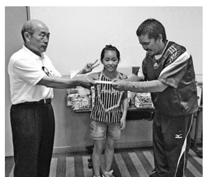
親子揃って優勝おめでとう

夏の雲と秋の雲が混じり合った九月四日(日)、数えて八回目、恒例となった健康体力作りボウリング大会。 四十七名が星ヶ丘ボウルに集まり、日頃の運動不足を嘆きつつ、成績を競い合