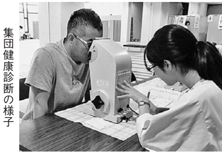
集団健康診断の様子