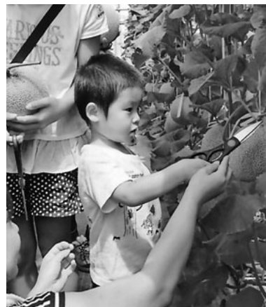
全員がお気に入りの一玉をお土産に

八月二十八日(日)、伊良湖へメロン狩り＆ホテルランチバイキングに行ってきました。予定より参加人数が増えバスを一台追加するほどの人気で、バス四台百三十二名の参加となりました。 メロン狩りのハウスに着し、係の方の説明を聞くのと、みんな一目散にメロンを採りに行きました。ハウ