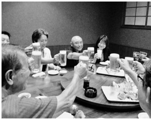
若い世代の方々と楽しく乾杯

八月二十日(土)、一宮支部は後継者育成事業を行いました。休眠中の支部青年部を復活すべく奮闘中です。 三十代の働き盛りの方々、ご夫婦の参加も二組あり、総勢十一名での懇親会。一宮駅構内のチェーン店を会場にしました。