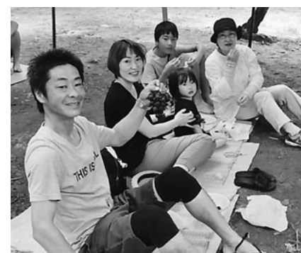
甘く実ったぶどうをお腹いっぱい

なく、甘みのあるマスカットベリーAを堪能。ご夫婦で参加された方からは「二人で五房も食べ、お腹もふくれて満足です」と喜びの声も聞かれた。 役員は、全建愛知のパンフレットを見せながら労災など他団体との違いを説明して、未