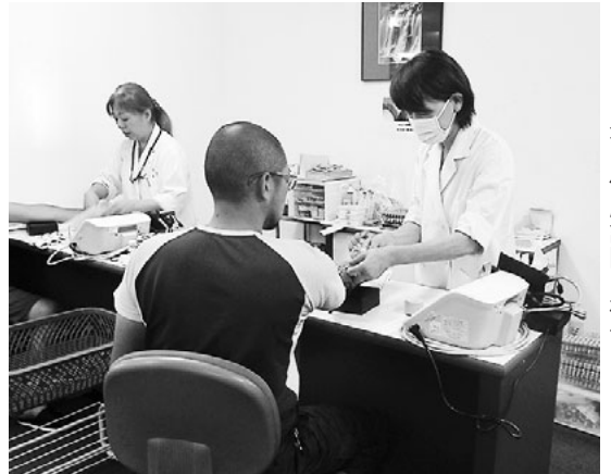
集団健康診断の様子

※集団健康診断を受診される方は、必ず会場へ「健康保険証」をご持参ください。 また、事前予約の必要はございません。 ※受診者の方々が多く、会場がたいへん混雑する場合があります。所属支部に関わらず、どこの健診会場でも受診していただけます。 ※今月号以降のキャロット、HPをご確認の上ご利用ください。