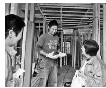
若い職人さんに説明する役員さん

日頃は、全建愛知の組織拡大行動に御協力を頂き誠に有難うございます。消費税の増税・社会保険未加入対策の取り組み期限・建設産業と労働者の賃金単価引き上げ等々難題が多い中、景気は回復傾向にむかいつつも、まだまだ実感するに至っていません。拡大グッズの有効活用をして頂くと共に紹介者への商品券配布などを行い皆様の協力を得て現場の仲間や未加入の方々に積極的に声をかけをして頂き春の組織拡大行動に向けて一層のご理解、ご協力を宜しく御願致します。