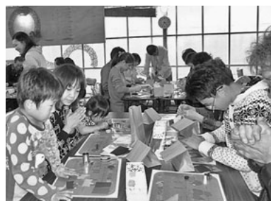
キャンドル作りにみな夢中

ンドル体験の旅へ、六十三名で行ってきました。満開の桜に送られて、あいにくの雨でしたが、まずは小牧かまぼこ。試食を頂きながら、お土産の品さだめ。