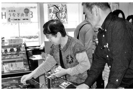
お土産いっぱい大忙し

いにくの曇り空ですがここ数日は雨続きだったので運がいい方かも。ほほをなでる春風はあたたかく、いざ東名を一路浜名湖へ!! 湖を眼下に見下ろす湖畔のホテルで豪華な食事と温泉入浴を楽しんだ後は、目指すイチゴ狩りへ!! 近くの農園で大粒の「あきひめ」にミルクをつけてパクリ。あちこちで「甘いね」の声。帰りのバスを降りる人たちの両手にはえびせんべい、うなぎパイ、ちくわ、そしてイ