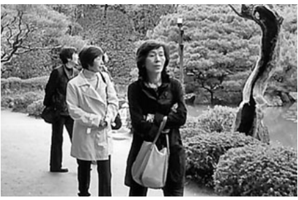
平安神宮神苑を散策

四月十五日(水)、久しぶりに参加した人と八人で京都方面に行ってきました。天気予報では雨、とくに西の方は大荒れになる様子との事。覚悟して出かけました。