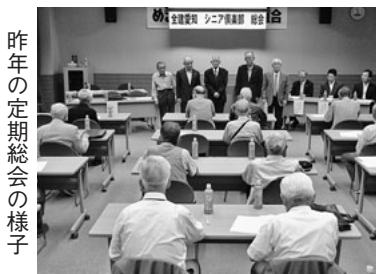
昨年の定期総会の様子

シニア倶楽部が設立され、約7年になります。現在では、会員の方々に研修旅行等を通じ、仲間同士の交流を深めてもらい、活発に活動しています。