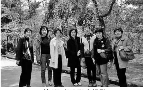
枝だれ桜と記念撮影

四月十五日(水)、久しぶりに参加した人と八人で京都方面に行ってきました。天気予報では雨、とくに西の方は大荒れになる様子との事。覚悟して出かけました。