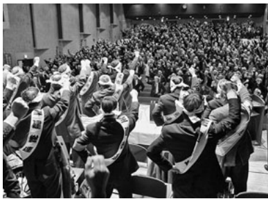
全国から689名の仲間が集結

全建愛知 全愛知建設労働組合 〒455-0008 愛知県名古屋市港区九番町4-1-10 電話 (052)659-0288 FAX (052)653-0181 0120-154-931 050-3785-1684 E-mail: honbu@zenken-aichi.com