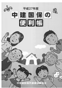
27年度中建国保の便利帳

【お問合せ・予約ご連絡先】 猿投温泉ホテル金泉閣 Tel.(0565)45-6111 愛知県豊田市加納町馬道通21 営業時間/10時~24時(日・祝は9時~24時)年中無休