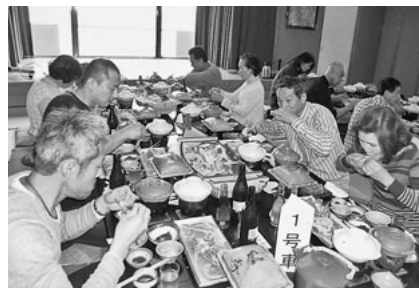
日本海の幸が盛り沢山

四月五日(日) 小牧支部は、支部総会・レクを越前グルメ及びびろーザンベリー多和田、天然みつろうキャン