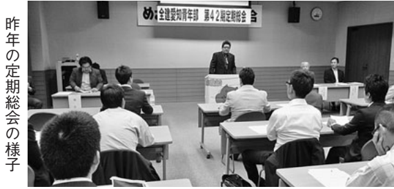
昨年の定期総会の様子

全建愛知青年部では、この1年間の活動経過や決算を報告し、今後の活動方針や予算案を確認するため、毎年「定期総会」を開催しています。