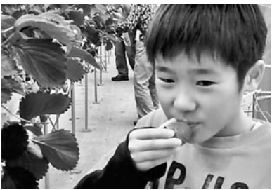
大粒イチゴをパクリ

春日井支部の春のレクリエーションが四月十九日(日)に行われました。今回はバス四台で浜松の館山寺へ昼食とイチゴ狩りの旅です。あ