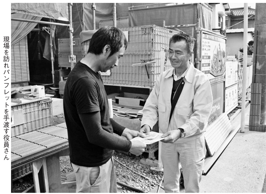
現場を訪れパンフレットを手渡す役員さん