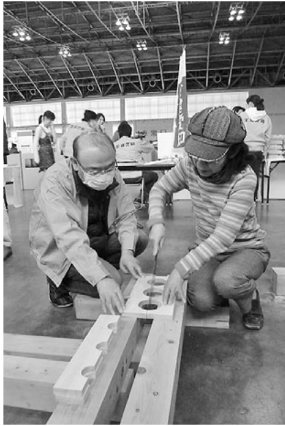
墨つけ通り切れるかな

あいち住まいるフェア2015(旧名称ハウジング&リフォームあいち)は、三月十三日(金)～十五日(日)の三日間、吹上ホールにて開催されました。三日間で一万四千百人の入場者で盛況のうちに終了しました。 住宅対策部は、今年も体験・催事コーナーでは「大人のためのDIYコーナー」として、ワインラック作りのワークショップを設けました。参加者は図面を見ながら、役員さんたちの指導のもと材木に墨付けをしてそれを加工して組立てていきます。例年より作業工程の多い内容になっており、完成した時には参加者から「できた!」と歓喜の声が上がりました。子供の参加者の中には途中で退場してしまいましたが、そのうちにもう一回参加したいという声も聞かれました。