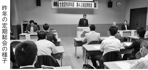
昨年の定期総会の様子

全建愛知青年部では、この1年間の活動経過や決算を報告し、今後の活動方針や予算案を確認するため、毎年「定期総会」を開催しています。