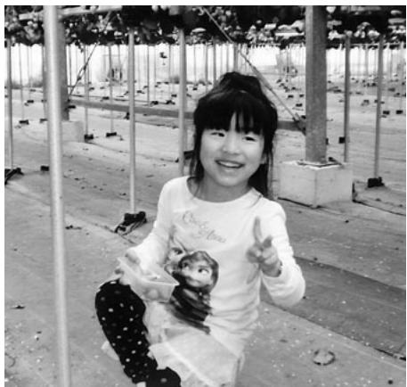
いっぱい食べたよ