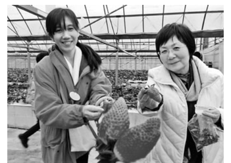
大きく甘いイチゴを食べ放題

二月二十二日(日)、中川熱田支部主婦の会では、一般の知多半島いちご狩りバスツアーに二十名が参加した。