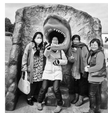
童心にかえてポーズ

「子どもが小さい頃に比べて久しぶり」と言う人がほとんどの南知多ビーチランドに到着。水族館ではいよいよわしの大水槽がお出迎え。アシカのコミカルなパフォーマンスは「エビフライが二匹だったら良かったね」とちよっぴり不満の声も。その後の魚太郎では両手におみやげがいっぱいになった。