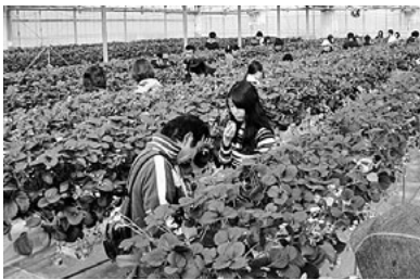
広々としたいちご畑