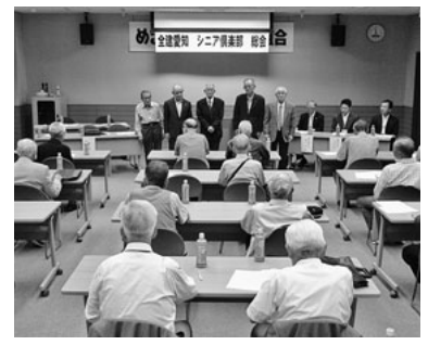
昨年の総会の様子

シニア倶楽部が設立され、約七年になります。現在では、会員の方々に研修旅行等を通じ、仲間同士の交流を深めてもらい、活発に活動してまいります。 そこで、シニア倶楽部では、第四十二期の経過報告や決算を報告し、第四十三期の運動方針案や予算案など、来期の活動内容を知っていただくため「第四十三期総会」を開催します。