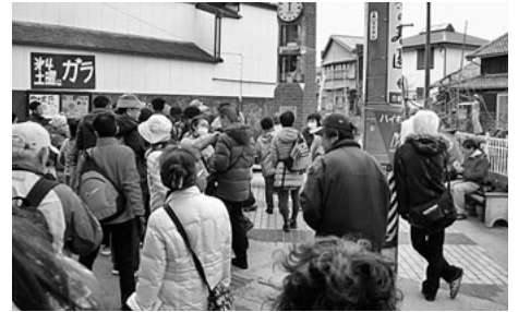
多くの参加者が挑戦

二月二十二日(日)、今日はいちご狩りです。参加者は百八名です。港区内のいちご畑です。朝から天気がよくない様です。午前中だけでも雨が降らない様だと思いいちごハウスに行きました。