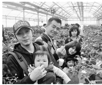
いっぱい食べて大満足

ハウスの中に入ると、大きな赤いちご半分ほどの赤い小さいいちごが沢山あります。「ワッ! あれ大きいな、あそこにも!」とワイワイ、ガチャガチャです。家族連れあり夫婦連れありです。ハウスの人に説明を受けて中に入りました。「こは章姫、紅ほっぺが主流です。章姫は少し実がやわらかく、紅ほっぺは甘みがあり実がしっかりしています。」