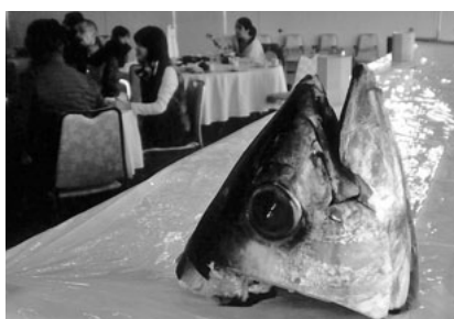
まぐろを食べ尽くす

三月十五日(日)、東海支部バス旅行は、総勢九十名バス二台で、静岡県焼津方面に出発!最初の目的地、可睡齋に、時間通りに到着。日本最大級!三十二段二百体のひな人形に大感動!!