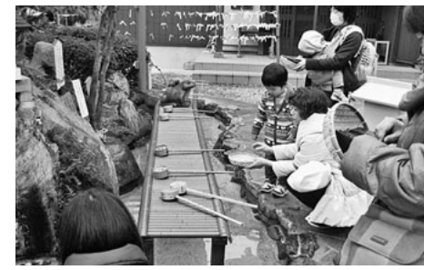
倍返しを期待して

屋食は「Bistro sou'sou」にてフランス風家庭料理。一口サイズの前菜が何種類も盛りだたプレートから始まり、スープ、メイン、デザートととても美味しく大満足。おなが満たされた後