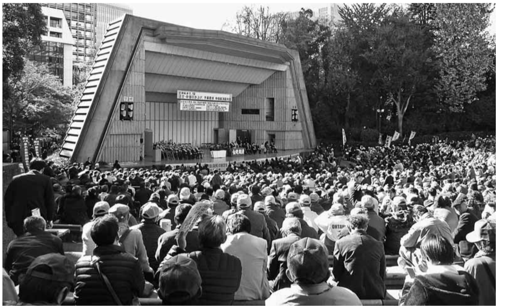
昨年11月19日、日比谷公園大音楽堂に全国の仲間5,002名が集結(中央総決起大会)