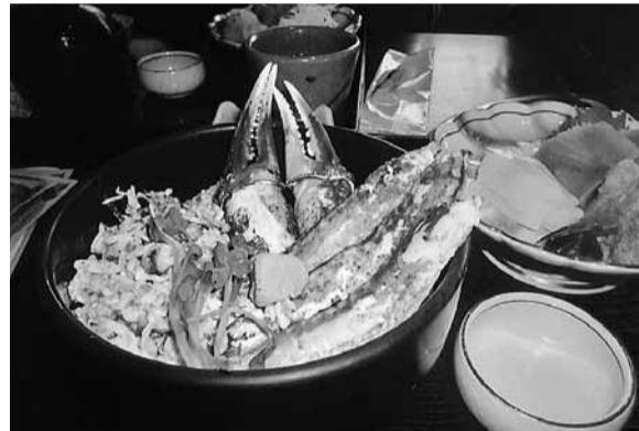
日本海の幸をぜいたくに

お買物ツアーに行ってきた。参加者十七名、植田駅より出発。二、三日前には雪が降っていたので、「足元が滑ったり濡れたりしないような靴を履いて」と言っていました。心配もない天気でした。 最初の買物先、かまぼこ館、昆りのお土産がありました。布館ではプレゼントをいただき、バスの中では、何点かの景品れしかたです。日本海さかな街を、添乗員さんの好意でジャンケでは食事券を使って好きな食食、好きな所へ行きました。さかな街盛り上がり。渋滞もなく予ではたくさん買物。めがねの定より一時間早く到着し、買物里、越前そばの里でも、ちよびいっばいの楽しい旅でした。