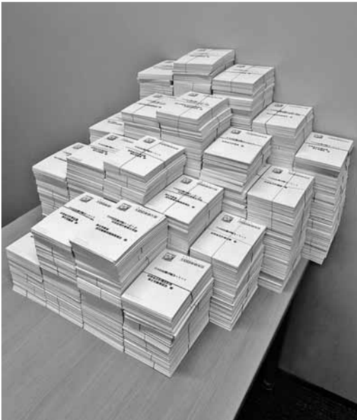
ご協力いただいた22,709枚(冬のハガキ要請行動)

今後とも力を緩めることなく、全国の仲間と共に予算要求運動に全力で取り組んでいきますので、引き続きご協力お願いいたします。