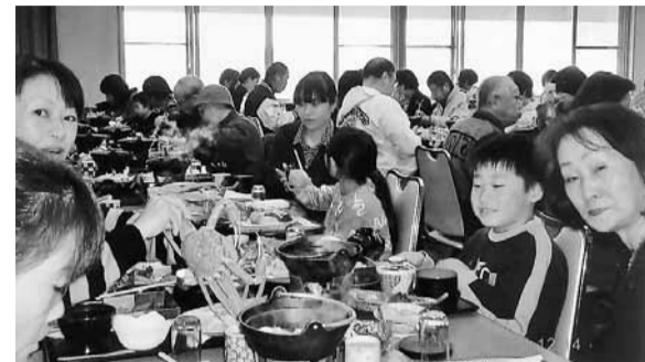
黙々と盛り上がってます

十二月十四日(日)、豊橋支部主婦の会で敦賀名で行ってきました。小牧を過ぎたころから雪が舞いだし、トンネルを抜けるたびに道路も山々も雪景色一色。福井に入ると除雪車も出ていて心配しましたが、やはり気比神宮は雪の為、車窓にてお参りし、お楽しみのカニ料理店「瀧雅(たきまさ)」へ到着。号車ごとにテーブルにカニとカニづくしのお料理で、皆さん黙々とカニづくしに舌鼓を打っていました。