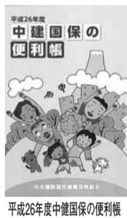
平成26年度中建国保の便利帳