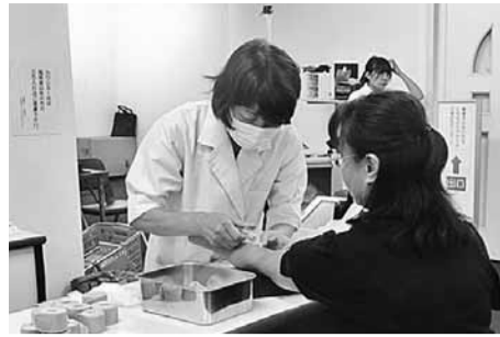
集団健康診断の様子

今年度、被保険者四十歳以上七十五歳未満の方の受診率六十五%を目標としていきます。