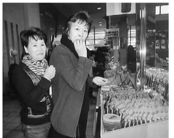
どれもこれも美味しくて困ります