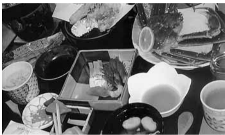
豪華なカニづくし

次は、最後の日本海さかな街へ到着。カニと魚セツトのお土産をどっさり買われ、バスのトランクは一杯でした。帰りの車中では、ビンゴ大会で盛り上がり楽しい一時でした。少々渋滞もありましたが、予定より三十分遅れで無事豊橋へ帰ってくる事ができました。次回も楽しみにしていきます。 【荻原康子 記】