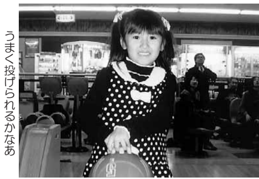
うまく投げられるかなあ

ゲーム終了後は、イベントホールで昼食と成績発表と参加者の皆様に賞品が贈られました。 そして、ファミリー賞の抽選会!! 一等大型テレビ。密かに狙っていましたがかスリもせず(泣)。来年もボウリング大会、恒例のレクを盛り上げていきたいので、支部組合員の皆さん是非参加してください。 【河野弘貴 記】