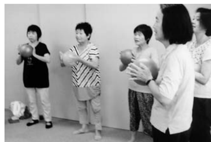
熱心に取り組んでいます

緑支部主婦の会は八月三十日(土)に徳重コミュニティセンターにて、七名で先生指導の下、「健康体操」をしました。年々低下する筋力を維持する為の「貯筋体操」です。ボールを使って股の内側の筋肉を鍛えたり、リズムにのって肩や肩