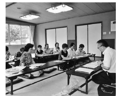
熱心に講義を聴く参加者

徳商法の特徴(訪問販売、点検販売、催眠商法、利殖商法、振り込め詐欺、送りつけ商法、開運商法、当選商法、かたり商法、展示会商法)を詳しく説明していただき、クーリングオフ期