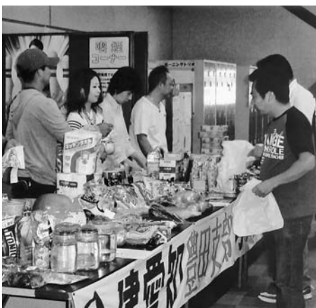
どれにしようかな