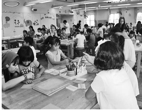
たくさんの親子が参加

港支部は、八月十六日(土)～八月十七日(日)に「とだがわこどもランド」で住宅デー親子木工教室を開催しました。作品はえんぴつ立を親子でつくろうです。来場者十六日(土)は五十四名で十七日(日)は三十八名で、名古屋市区と県外の参加者もありました。指導員はのこぎり、金槌、各道具の使い方指導をし、オリジナルのえんぴつ立を完成させ気分は大工さんでした。後は各