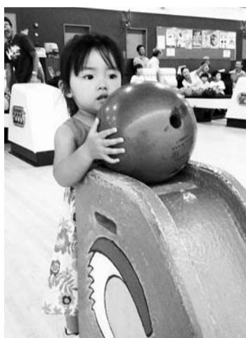
ストライクとるよ