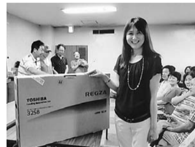
テレビもらっちゃった

八月二十四日(日)豊田支部主催のボウリング大会が「美鳥里ボウル」にて開催されました。毎年恒例のレクなので、