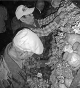
昨年の様子(舞茸狩り)

毎年大好評のシニア倶楽部主催の日帰り研修旅行「秋の京都御所の旅」を開催いたします。