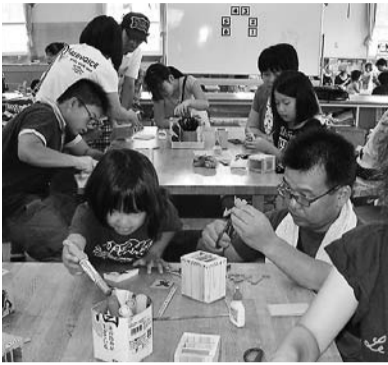
真剣なまなざしのお父さん