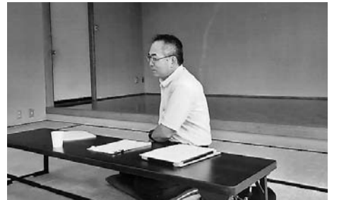
熱弁をふるう講師