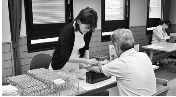
集団健康診断の様子

但し、二十歳未満の家族被保険者の方が希望する場合は、実費負担で受診いただけます。 ※中建国保未加入の組合員及び組合員外は受診できません。 ※中建国保に未加入の組合員は加入している医療保険者(市町村・協会けんぽ等)へお問い合わせください。また、中建国保未加入の組合員や組合員外の方は、この機会にぜひご加入をお薦めします。