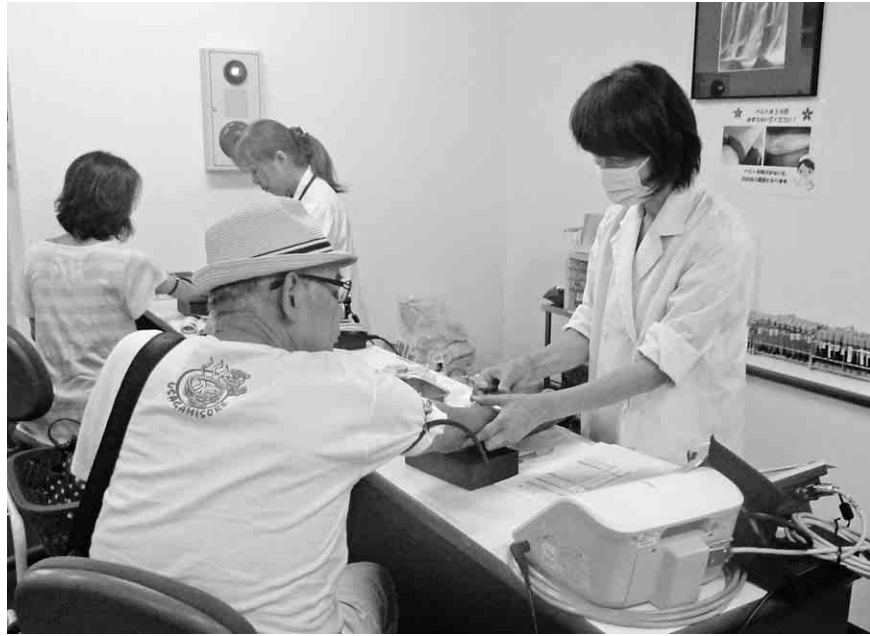
組合が実施する集団健康診断を受ける組合員

社会保障対策部 皆さんのご奮闘に敬意を表します 国保予算要求に向けたハガキ要請行動