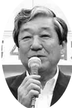
衆議院議員 赤松 広隆

の中間の仕事と暮らしを守るためにも、消費税の更なる増税の反対を強めていきます。全建総連の三月末の組織人員は、六十万九千二百二十二人。一年間で二千六百五十一人が減少しました。しかし、五十三県連・組合の四割を超える二十二の県連・組合では、増勢を勝ち取っていることから、今年十月の全建総連の定期大会までには、組織人員を増やしていきます。