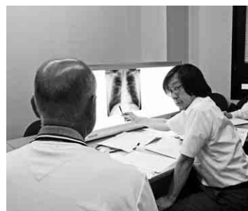
面接指導を受ける組合員(左)

七月二日(水)東京・日比谷公園大音楽堂にて「全建総連7・2賃金・単価引き上げ」予算要求 全国総決起大会が開催されました。全建総連からは四役六名、尾北支部組合員二十九名、佐野青協幹事、書記局