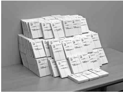
たくさん集まったハガキ

そのご家族の皆さんにお願いいたしましたところ、二万二千八百四十八枚のハガキが集まりました。手書きによるハガキの一文一文字には、「何としても、建設国保を守り抜くんだ」という切実な思いが込められています。