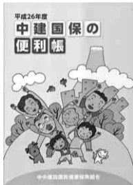
平成26年度 中建国保の便利帳

※スパーランド・パスポート・ジャンボ海水プール入場券にて入園後、「湯あみの島」利用の場合は、別途料金が必要。 ※上記料金は、全て消費税込みです。利用券は団体でのご利用はできません。 ※スパーランド入場券は、遊園地の入場のみ。(ジャンボ海水プール・湯あみの島入館不可) ※バスポートは、遊園地の入場及び乗り物乗り放題。(ジャンボ海水プール・湯あみの島入館不可) ※ジャンボ海水プール入場券は、ジャンボ海水プール・遊園地の入場可。(湯あみの島入館不可) ※ワイドパスポートは、ジャンボ海水プール・遊園地の入場及び乗り物乗り放題。(湯あみの島入館不可) ※湯あみの島入館券は、遊園地の入場可。(ジャンボ海水プール入場不可) ※バスポート・ワイドパスポートでは「ポケモンアドベンチャーキャンプ」及び「ちびっこひろば」は利用できません。 ※ジャンボ海水プール内に、サンシェードの持ち込みはできません。 ※名古屋アンパンマンこどもミュージアム&パークは別途料金が必要です。