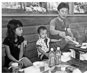
ハーベキュー最高