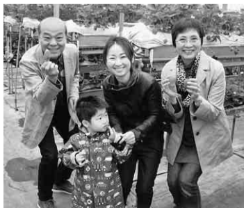
イチゴ、美味しいよ

中支部主婦の会が開催する伊勢内宮日帰りの旅が、四月二十日(日)参加者四十一名で行われました。