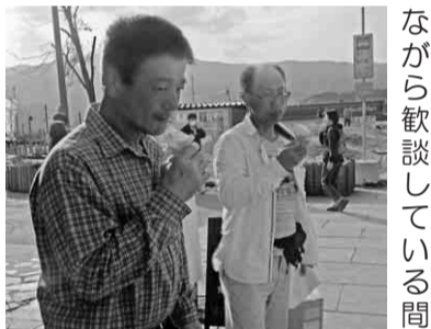
ソフトクリーム、うまい