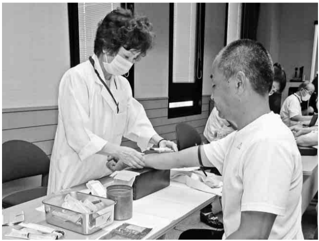
集団健康診断を受ける組合員

健康診断の 受診資格 「中建国保に加入してい る本人と今年度二十歳以上 となる家族被保険者」に限 ります。 但し、二十歳未満の家族 被保険者の方が希望する場 合は、実費負担で受診いた だけます。 今年度、被保険者四十歳 以上七十五歳未満の方の受 診率六十五%を目標として います。 目標が達成できない場 合、国からの補助金が減額 され、来年度以降の保険料 が引き上げられる可能性が あります。