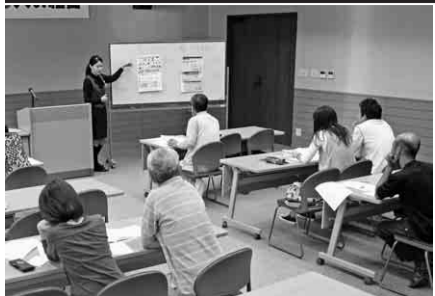
税金講習会の様子