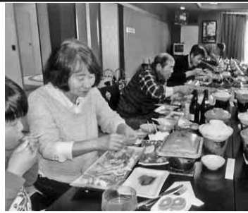
美味しくそうなカニをほうばっています