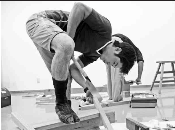
真剣な様子で作業する受講者

全建設労働組合連連合 全建設労働組合連連合では、青年大工技能者の育成と技能尊重の気運醸成を目的に「全国青年技能競技大会」が開催されており、