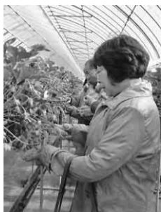
このイチゴにしよう

四月六日(日)小牧支部は、総会と支部レクを兼ねた越前グルメ及びイチゴ狩りへ三十八名が参加しました。