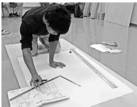
昨年の講習会(製図の様子)

参加者の中で優秀な方には「第三十回全国青年技能競技大会」に代表選手として出場していただく予定です。(東京都で開催)