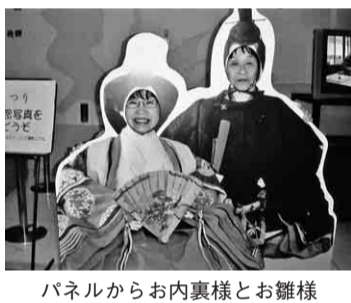
パネルからお内裏様とお雛様

各地で桜満開の四月二日(水)、好天に恵まれ暖かい日に、緑支部主婦の会八名は午前十時金山総合駅に集合し、JR中央線にて大曽根駅へ向か