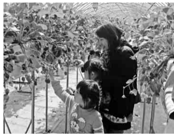
このイチゴにしよう

色とりどりの可愛らしさと素晴らしい「素敵」の連発、写メールをしたりしてにぎやかな一時でした。昼食にトロづくしを堪能し、ミルック片手に「何個食べたの」と話しながら満腹しきった様子でした。