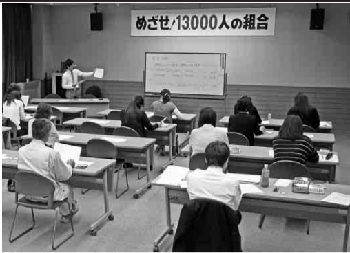
税金講習会の様子