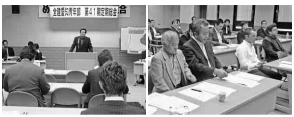
昨年の定期総会の様子 大勢の参加者

全建愛知青年部では、この1年間の活動経過や決算を報告し、今後の活動方針や予算案を確認するため、毎年「定期総会」を開催しています。青年部員の皆さん、ぜひ、第42期定期総会にご参加ください。また、定期総会終了後は、場所を変えて懇親会を開催します。この不況を乗り切るためにも青年部員同士、交流を深め、団結力をさらに強め、組合及び建設業界を活性化していきましょう。