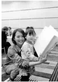
賞品いただきニコニコ

緑支部は、四月六日(日)金山サイプレスガーデンホテルで総会と懇親会を七十二名の参加で開催しました。昨年までは、保険証交換後、総会を行っていましたが、今回は総会の後に懇親会を行い、組合員の親睦を図り支部行事に参加しやすくしようと企画しました。総会は、四十二名の参加で滞りなく進み、四十五分程度で閉会する事が出来ま