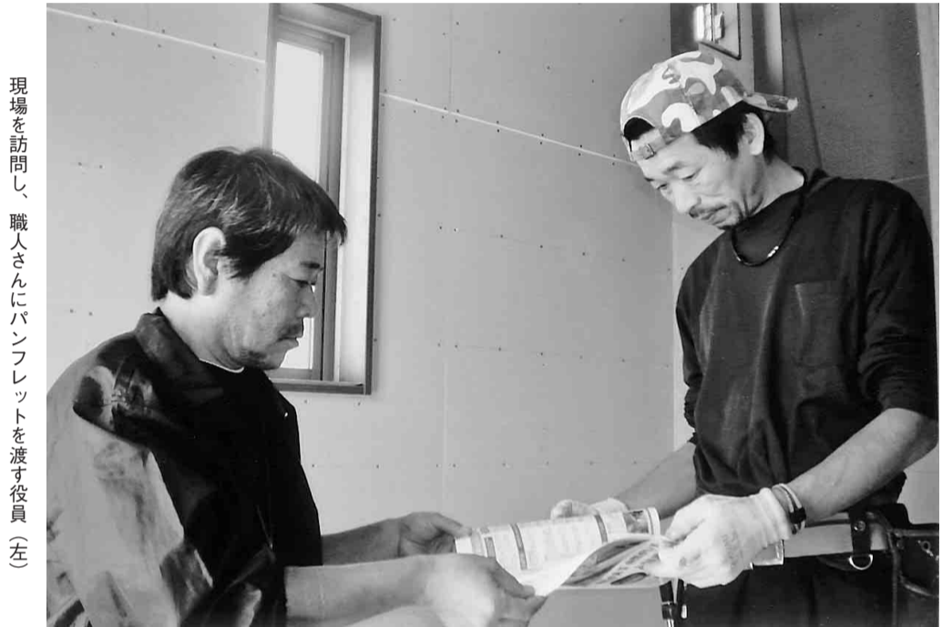
現場を訪問し、職人さんにパンフレットを渡す役員(左)