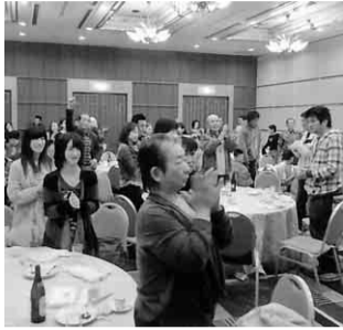
楽しく交流を深めています

緑支部は、四月六日(日)金山サイプレスガーデンホテルで総会と懇親会を七十二名の参加で開催しました。昨年までは、保険証交換後、総会を行っていましたが、今回は総会の後に懇親会を行い、組合員の親睦を図り支部行事に参加しやすくしようと企画しました。総会は、四十二名の参加で滞りなく進み、四十五分程度で閉会する事が出来ま