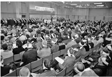
3.26中央決起集会の様子