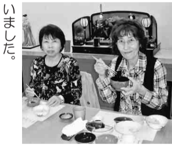
美味しいお料理を堪能

徳川美術館へ尾張徳川家の雛まつり鑑賞のため、大曾根へ来たのは初めての人が多かったが、十分位散策しながら着きました。【杉浦由紀子 記】