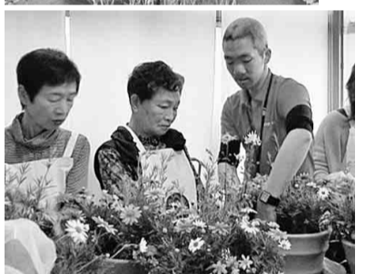
先生に教わりながら作業しています