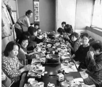
豆腐や湯葉料理を堪能

その余韻に浸ったまま「梅の花」に移動し、豆腐と湯葉料理を自己紹介をしながら食べました。