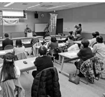
熱弁を振るう講師

地震によって、家具の下敷きになってしまい身動きが取れず死に至ることが多くあり、そこで、家具を固定することに命が助かり、また非難する時間も取れるなど、現物の固定器具を見せてもらいながら、講義を受けました。