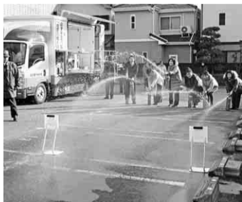
早く火を消すんだあ

一月十五日(水)、全建愛知会館で防災講習会(消火器噴射体験・起震車の乗車体験)を参加者十六名で行いました。