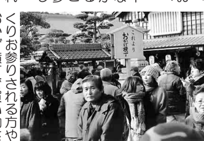
おかげ横丁も賑わっています

ご夫婦で参加された組合員さんは「お伊勢さんは別格です。平穏な一年になる様にお祈りしました」とおっしゃっていました。内宮で時間をとって