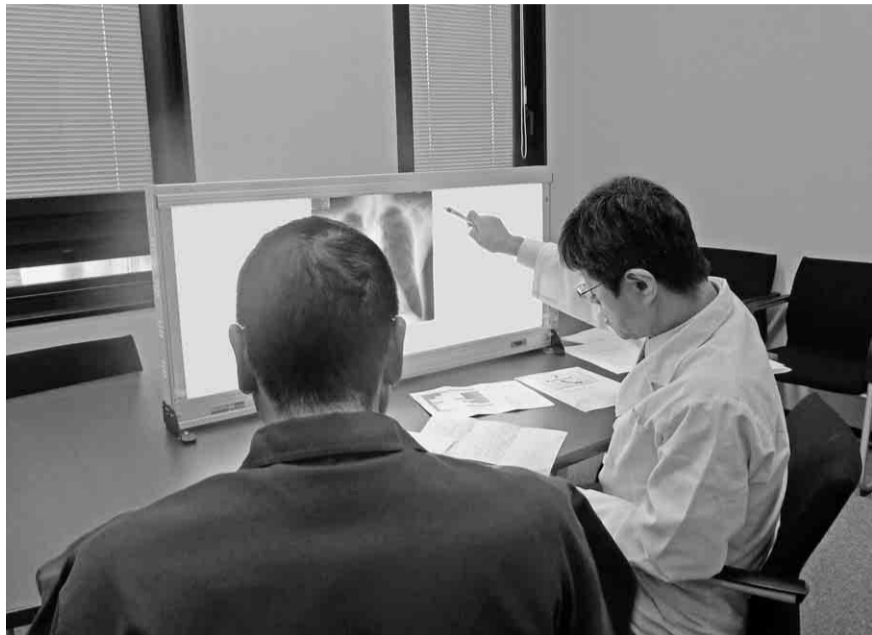
面接指導を受ける組合員(左)

「一人親方労災保険」(以下、 労災保険)に加入されて いる方は、三月末日をも つて期限が切れるため、更 新の手続きを行っていただ く必要があります。