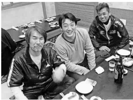
とっても楽しいですよ

新年を迎えて1月19日(日)に、名古屋駅西の仙石ずしで、中村支部壮年部主催の新年会を行いました。当日は寒い中、北支部から昨年結成された壮年部長及び役員さんにもお越しいただき、総勢29名の参加になりました。