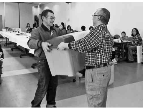
大きな賞品が当たった参加者(左)

二月二日(日)に旭瀬戸支部は、毎年恒例のボウリング大会を開催しました。参加者大人・子供含め六十名で、今年も朝九時十分、数本支部長の始球式でスタートしました。昨年までと違う腕前を披露した支部長さん。