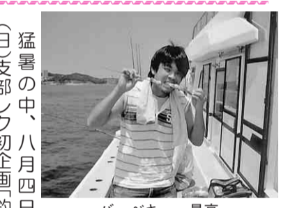
バーベキュー最高