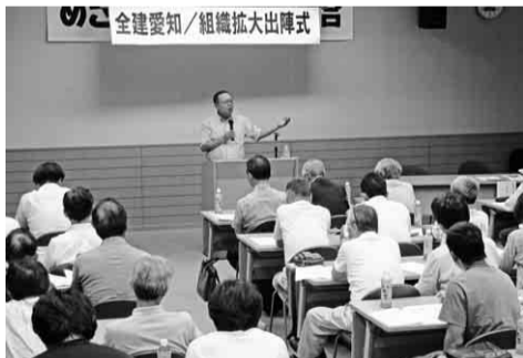
全建愛知/組織拡大出陣式

招きした清水組織部長から、「組織拡大の取り組み方・組織率の現状・役員としての認識と自覚・組合員宅の訪問作戦」等、たいへん前向きな熱の入った講演が繰り広げられました。講演では「全建愛知の構成割合の特徴として、若い組合員が多く、その反対に老年者の割合が少ないので、たいへんバランスが取れていますが、組織人員が低い」。組合員宅訪問では、「女性も含め、三人一組が好ましい。一人で訪問するより話題が広がるため」