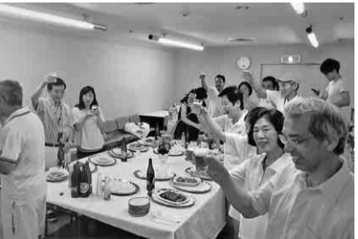
お疲れ様でした 乾杯