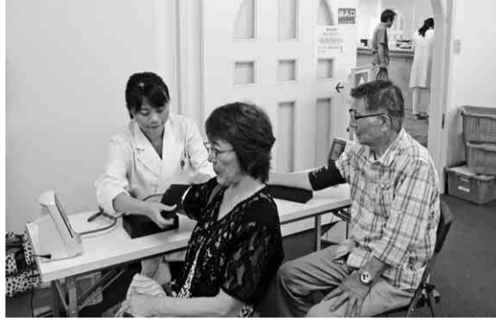
集団健康診断の様子

健康診断の受診資格 ・本人と二十歳以上の家族被保険者」に限り ・但し、二十歳未満の家族被保険者の方が希望する場合は、実費負担(一万円)で受診いただけます。 ・中建国保未加入の組合員及び組合員外は受診できません。 ・中建国保に未加入の組合員は加入している医療保険者(市町村・協会けんぽ等)へお問い合わせください。また、中建国保未加入の組合員は、年一度は必ず健康診断を受けましょう。