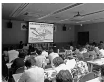
プロジェクターを使っの講習会