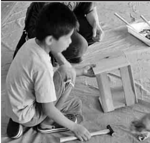
自慢のブックスタンド完成