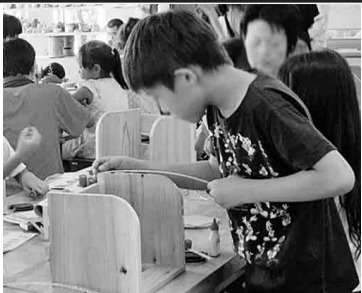
真剣な様子で作業する男子