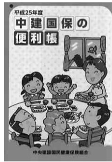
平成二十五年度中建国保の便利帳

中建国保の健全な運営のため、職種の変更・組織変更(個人から法人)・転業・廃業等がありましたら、速やかに組合の健康保険・共済課へご連絡ください。