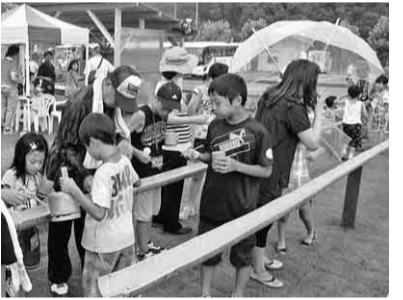
大人気の流しそうめん