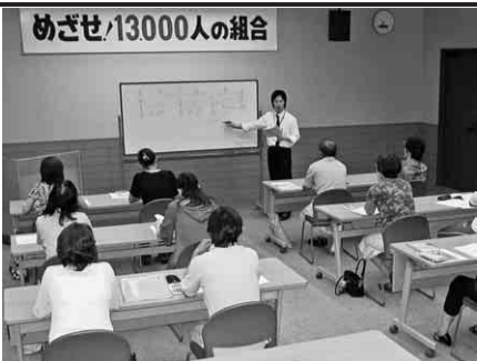
税金講習会の様子

初めて記帳をされる方や不慣れな方は、ぜひご参加ください。 ■日時 十月三日(木) 白色/午前十時~ 青色/午後一時三十分~