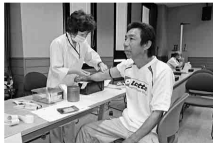
集団健康診断の様子

※受診希望日の2週間前までに、「契約健診施設」へ直接電話予約をしてください。 ※エルズメディカ名古屋は、女性専用の健康診断施設になります。ご注意ください。 ※契約健診機関で受診され、アスベスト撮影をご希望される方は、レントゲンフィルムを組合までご提出ください。 ※オリエンタル蒲郡健診センターは、2013年4月1日より所在地及び連絡先が変更となりました。ご注意ください。