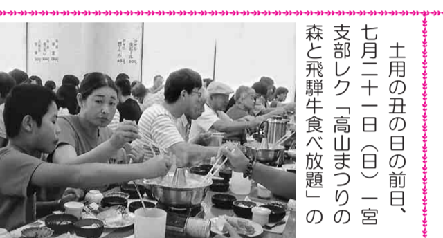
しゃぶしゃぶ最高

千種支部主婦の会／日間賀島納涼まつり 翌日は朝食の後、島を散策。船に乗る前に昼食をいただき大満足で帰路につきました。