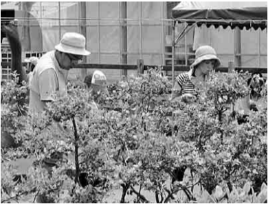
このブルーベリーにしよう