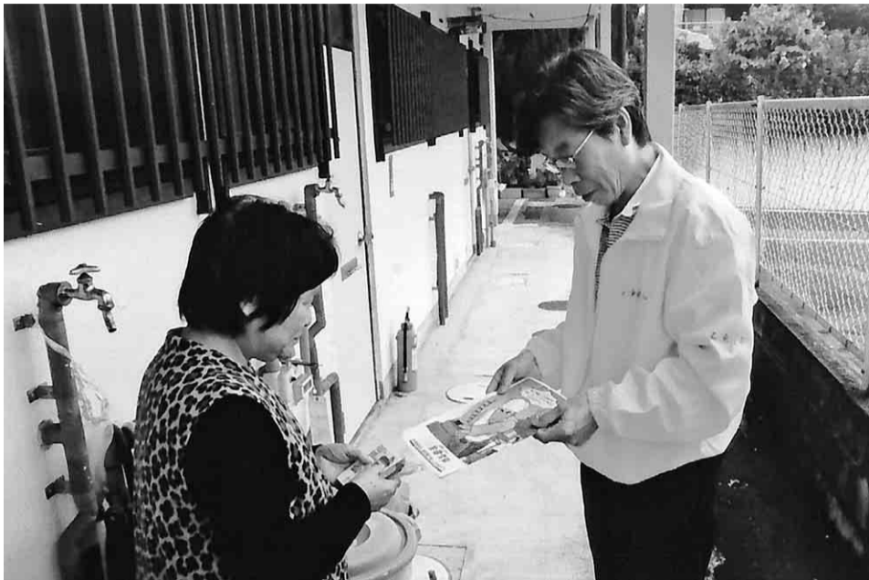
組合員宅を訪問し、熱心に組合説明をする役員(右)

集まるからこそできることを実現する。そのための組織拡大だとご理解いただければ幸いです。今期は、五カ年計画の締めくくりとなる強化月間です。ぜひ、未加入の方に積極的に声掛けをお願いいたします。皆様の日頃のご協力に感謝を申し上げます。目標達成へ向けよう、お願い申し上げます。