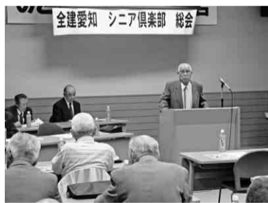
昨年、開催した総会