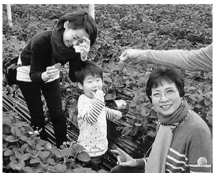
真っ赤に熟したイチゴ

総合案内としてパンプレットを渡し、増改築や耐震工事には地元業者を指名して貰う、紹介しました。また、組合の箸つくりセットを借り「マイ箸つくり」に挑戦、最初はうまく行かず三本、四本と作っているうちにいつか一緒に満足げに持ち帰られました。【後藤武雄 記】