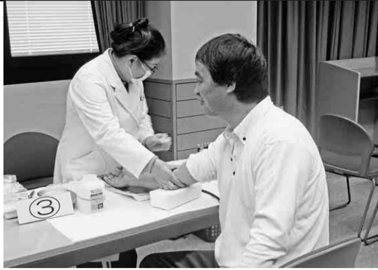
巡回健診を受ける組合員

私たち建設職人は体が資本です。健康管理の第一歩は、定期的な健康診断から始まります。ご自分の大切なお体です。どうか、早期発見・早期治療のためにも、年に一度は必ず健康診断を受けましょう。