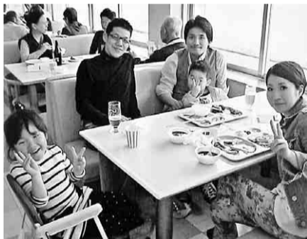
バイキングも最高

三月二十四日(日)、中支部は、全建愛知四十周年記念レクを静岡県掛川市で行いました。当日は五十名でのイチゴ狩り。真っ赤に熟した大きなイチゴを口にほうばり、うれしそうに微笑む者、イチゴで服を赤