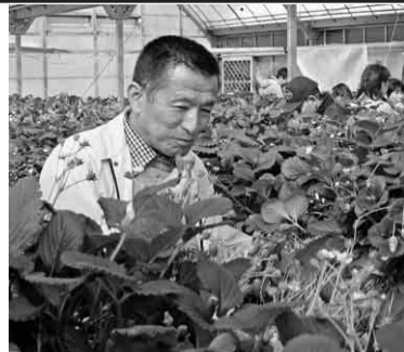
大粒なイチゴ美味しい

三月三日(日)南支部の支部レクが行われました。参加者は、支部員とその家族を合わせて百七十五名です。