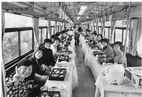
旬の春を味わっています

三月二十日(祝・水)、中川熱田支部主婦の会で明知鉄道「大正ロマンの旅」をしました。JR中央線で恵那駅に行き、滋養強壯の食の自然薯料理がすでに用意されている明知鉄道のじねんじょ列車に乗り。自然薯のさしみ、へぼ(峰の子)の佃煮、ほろ苦いフキノトウの天ぷら、ほとんどの人がおかわりをした麦ごはん等々、旬の春を味わいました。美人ガイドさんの「今日は自然薯、塩麴、一般列車の三両です。途中の飯沼駅は日本一の急勾配の駅で、富田地区は日本一の農村景観指定地区です」の案内で、沿線の風景も楽しめました。また、料理を作った会社の熟年パートさんの楽しい話に車内は盛り上がりました。終点の岩村では、左右の家におひな様が展示され、日本の原風景に出合った参加者十二名の思い出がふえたことでした。【位田仁美通信員】