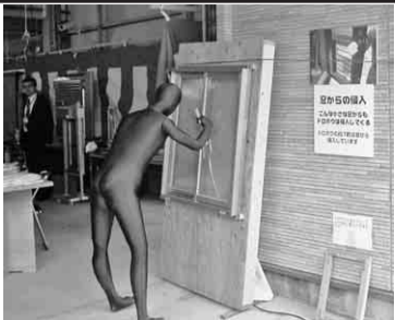
侵入者を真似た等身大

三月二十日(祝・水)、西支部と会員会社(株)名西建の共催で住宅デーを行いました。愛知県警による住宅を対象とした侵入盗の実態報告では、愛知県が六年連続で全国的に最も危険な状況で