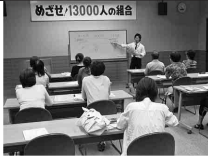
税金講習会の様子