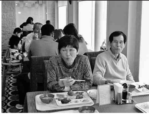
美味しい食事に大満足

百名の定員を予定していましたが予想以上の申込みがあり七百十名に増員をしたが、それでも定員を超えたため各支部共にお断りをした人も多くありました。