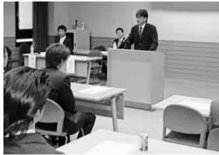
四十期定期総会の様子