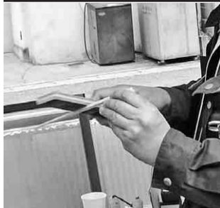
上手に箸を作っています

うイチゴ園です。ここは、農協が経営していて、地元農家の直売所が併設されています。イチゴの品種は、「章姫」です。みんな大粒で真っ赤なイチゴをお腹いっぱいになるまで堪能しました。昼食場所の「鳥羽シーサイドホテル」は、鳥羽湾を見渡せる高台の上にあり、景色を楽しむことが出来ます。温泉もあります。昼食は会席料理で、ここでもお腹いっぱいになりました。散歩をしたり、お土産の買物をしたりと皆さんゆったりと過ごしました。その後、式年遷宮が間近の伊勢神宮の外宮を参拝して帰路につきました。お腹いっぱい満足な一日でした。【堤圭一通信員】