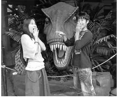
きゃあー食べられる