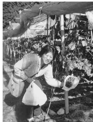
大粒の房のピオーネ

乗込み南信州へ向かいました。秋の大収穫と言いつことで、栗拾い・ぶどう一房狩り・りんご&なし狩りを楽しみました。