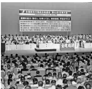
全国から1,343名が参加

全建連 第53回定期大会 組織を拡大・強化し、仕事とくらし、建設国保、平和を守ろう 全国の仲間一千三百四十二名参加