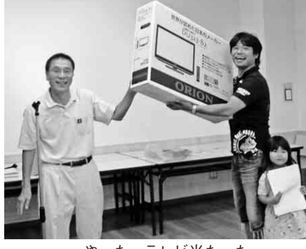
やった、テレビ当たった