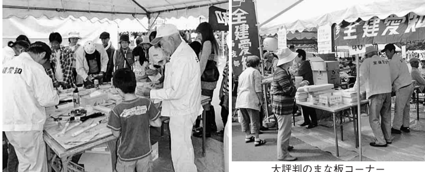
大評判のまな板コーナー

子どもたちは大はしゃぎ 南支部の今年の秋の秋の支度、組合の四十年記念行事も兼ねて長島温泉にて行われました。