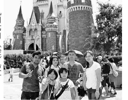
シンデレラ城の前で...

浅草寺参拝し、お土産を買った帰りに高速度道路も渋滞もなく北区へ帰りました。何年振りかの泊りの旅でしたが、皆さん、特にお子さんは、満足されたようでした。又、浅草も楽しみにと挨拶を交わし解散しました。 【西原進浩通信員 記】