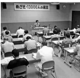
活動家育成学習会の様子

組織部 組織拡大強化月間(九月～十一月)に伴い、各支部の役員を対象に健康保険・労災保険・共済制度等を学習し、各自組織拡大行動に活かしていただくことを目的として活動家育成学習会を毎年開催しています。今回も支部役員コースと本部青年部・主婦の会コースに分けて二日間行いました。九月十六日(日)、本部青年部・主婦の会幹事を対象に二十四名の参加のもと全建愛知会館にて開催しました。学習会の内容は、全建愛知の構成・組合費の内訳等、健康保険・労災保険・組合共済制度の内容を学習しました。