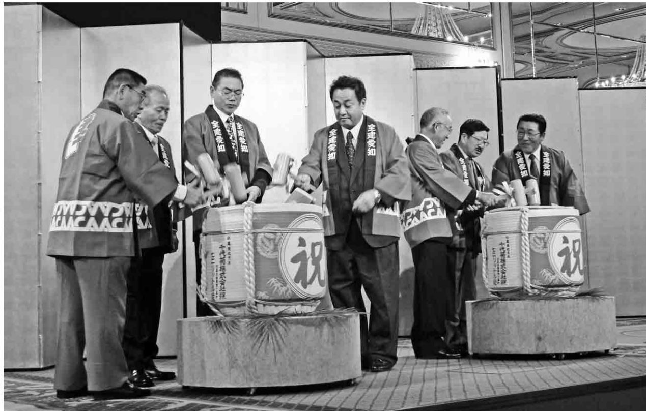
祝賀会で鏡開き「ヨイシヨ・ヨイシヨ・ヨイシヨ」