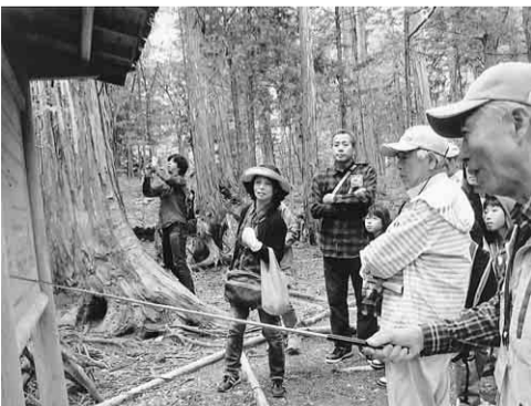
ガイドさんの説明を聞く参加者

植物が発散する酸素や香り、そして緑のシャワーを全身で受けとめ心身共にリフレッシュ出来たウォーキングとなりました。