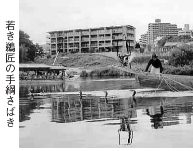
若き鶴匠の手網さばき

開門前から凄い人だかりでした。乗る物も一時間以上待ちがありました。あえなく乗れるものに乗りませんでした。ミッキーマウスの豪華絢爛なパレードに皆さん感動していました。快晴で歩くだけで汗ばみ皆さんアイスキャンデーをほお張っていました。一日自由行動で楽しみ、夕方ホテルへ戻りました。二日目は、浅草界隈散策でしたが、こどもスカイツリー効果か、凄い人出でした。