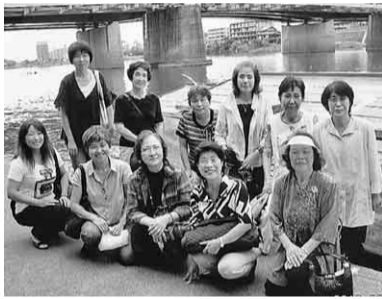
さあ、今から船に乗り込みますよ

九月十一日(火)、前夜の激しい雷雨も当日は残暑も一服の初秋日和。一行十一名は電車を乗継ぎ犬山へと向かいました。まずは、屋形船で川面の涼風を受け鮎御膳を賞味しながら犬山城を真上に仰いだり、木曾川の奇岩の間を巡り上水道の取水口を見物しました。