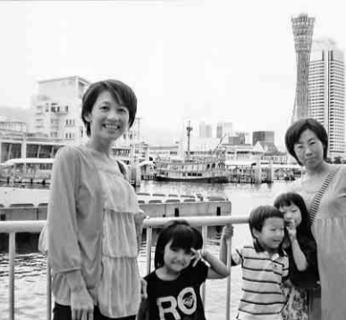
神戸港にてパチリ

今回は昼食をなくし、その分景品を豪華にし、順位に関係なく全員に当たるようにしたので、豪華賞品が当たった方は大満足、それ以外の方も大変喜んでいました。午前中だけでしたが楽しく過ごすごうができました。 【西崎洋子通信員 記】