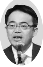
愛知県知事 オオムラ 大村 秀章