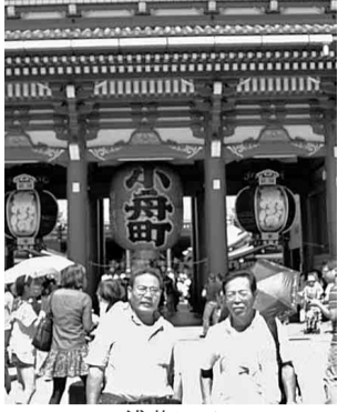
北支部/TDR・浅草散策の旅

帰りのバスの中は、疲れも出てくつす。帰りの渋滞も少なく、午後七時三十分は無事到着し、楽しく一日を終えました。 【下平敏一 記】