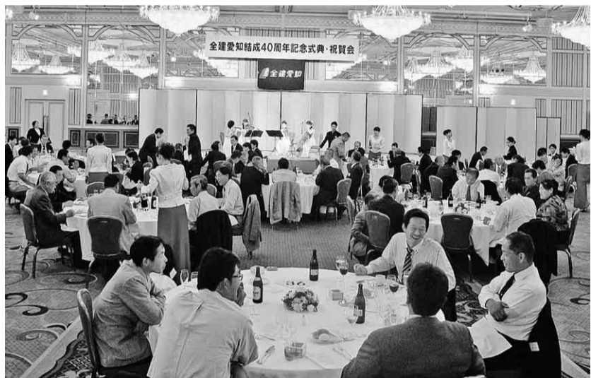
組合員同士会話も弾み賑やかな祝賀会