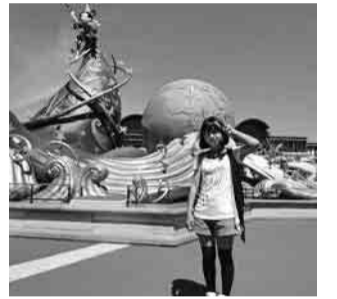
ミッキーと一緒に

行きのバスの中でのお子さんの「まだ着かないの?」「早くミッキーに会いたい」などの声を聞くと、皆さん楽しみにしていたんだなと感じました。そして到着。館内は、大変にぎやかで熱気に満ちていました。参加者の方にもすれ違い、楽しそうに顔を見ることができました。夜のパレードも盛り上がり最高の時間でした。