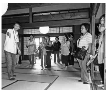
榎木館の和館を見学

歩き始めると、普段、車の移動が多い中、レンガ造りの市政資料館や真っ白な名古屋市役所を見学しました。