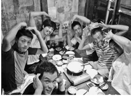
大盛り上がり親睦会

を与え合える最高の場だと思います。積極的に参加すればするほど互いに高め合えます。この場を逃すのはもったいないです。参加できる場所をフルに活用して、自分自身・支部を盛り上げていきましょう！