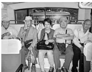
ダムへ向けトローリーバスで移動中

シニア倶楽部一泊研修旅行が、九月一日(土)〜二日(日)黒部ダムと上高地へ参加者三十三名(組合員二十八名・配偶者五名)と書記局員二名の計三十五名で開催しました。今年、組合結成四十周年を記念して、初の一泊研