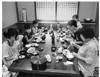
鮎の塩焼きを堪能

夏休みも終わりに近づいた八月二十六日(日)、今年も恒例の青年部主催の支部レクが、アソビックス尾西で開催されました。今年は大人三十名、子供六名と参加者が例年より少なかったですが、友好議員さんらも多忙の中、多数参加者がスタート。ストライクやスペアを取らたにハイタッチする光景が、あちらこちらで見受けられました。ゲーム終了後は、豪華な弁当を食べながらの表彰式。今回、大人はハンディを無くし、その代わり豪華商品も好成绩関係なしに割り振り、参加された皆さん喜んで頂き約三時間のボウリング大会の幕を閉じました。【石黒勲生通信員】