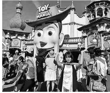
園内は大にぎわい

八月二十六日(日)豊田支部／青年部主催のボウリング大会が、「美鳥里ボウル」にて開催されました。参加者百四名。毎年恒例となりましたが、去年に続き参加者がと