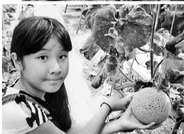
メロンをチョコキン

長久手支部／大井川S&Lとメロン狩りの旅 ウワァーS&Lだあ 目をキョロキョロさせとてみました。とてもいい思い出に残りました。【水野克実 記】