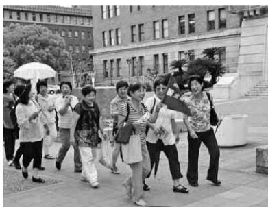
楽しくウォーキング中

修旅行として内容盛り沢山で企画されました。早朝、三十五人乗せたバスは金山を後に、中央道を順調に走り、車窓からア