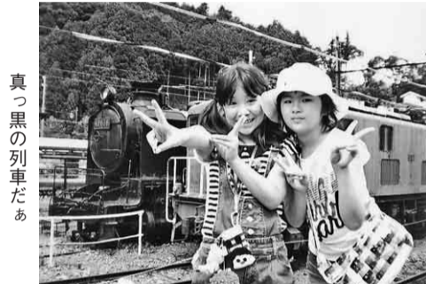
真っ黒の列車だあ

夏休み最後の日、総勢六十八名が健康・体力づくりボウリング大会に、星ヶ丘ボウルに集まりました。受付時間前に来ている方もあり、皆さん時間厳守でした。さすが職人さんは、朝に強いようです。支部長や、来賓の挨拶、そして始球式後、ゲーム開始です。ストライク、スペアをとった喜びで、あちこちから歓声があがっていたり、ハイタッチをしまわっている方たちもいました。ゲーム終了後、場所を移し、軽食と成績発表です。なお賞品は、みんなにあり、成績があまり良くなか