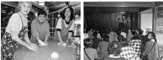
昨年、モクモクファームでパン作り 伊賀忍屋敷にて

毎年、大好評の「主婦の会日帰り見学会」を今年も開催します。 今年は、長野県伊那市かんてんばばガーデンと養命酒駒ヶ根工場見学・光前寺参拝をします。木々が色づき始めた信州を舞台に、寒天のトップメーカー伊那食品の敷地3万坪に生い茂る赤松並木かんてんぱパガーデンを散策します。続いて、健康薬酒でお馴染みの養命酒工場も見学します。試飲後は、皆さん疲れや冷えも和らぐのではないのでしょうか。 お昼は、信州の豪華なお食事をいただきます。とっても楽しい主婦の会日帰り見学会に、ぜひ皆さん、ご参加ください。お待ちしております。