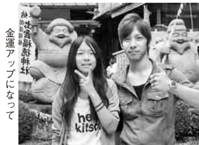
金運アップになって