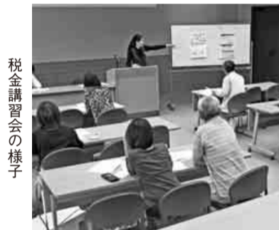
税金講習会の様子

全建愛知会館が築十年となり、会館を点検した結果、外壁のタイルを中心に修繕することになりました。 つきましては、外装工事の施工業者を募集します。 また、合わせて会館の植栽剪定業者も募集しますの で、ぜひ、「応募ください」 ①外装工事 【工事内容】 ・外壁タイル工事、 ・外壁塗装工事、 白色・青色記帳講習会 しっかり記帳していなければ各経費等が認められず、税務署による概算経費で再計算されることもあり得ます。 組合では、皆さんに日々の仕事のまとめや税額計算が簡単にできるような、講習会に参加された方には、「所得とりまとめ帳」を無料でお渡ししています。 白色・青色記帳(特別控除十万円)講習会では、所