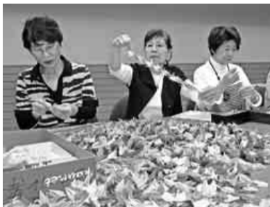
千羽鶴のつなぎ作業をする役員

八月五日(日)、広島の原爆犠牲者建設労働者・職員の慰霊碑前での慰霊祭に、三千羽の千羽鶴を献納と献水をしました。また、八月八日(水)長崎での慰霊祭にも三千羽の千羽鶴を