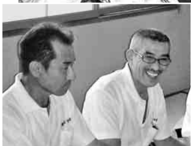
楽しく笑いもある勉強会

七月二十九日(日)守山支部役員十一名は、長引く不況の中で、組合員やその家族が安心して働