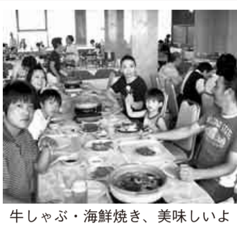
牛しゃぶ・海鮮焼き、美味しいよ

猛暑の七月二十九日(日)、青年部企画の東尋坊日帰りツアーを開催しました。 この暑さにも負けず総勢四十一名での出発です。