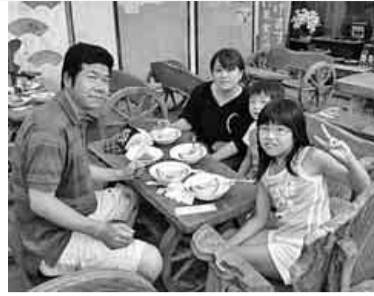
メロン美味しいよ