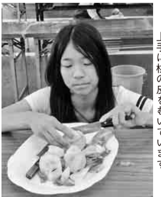
上手に桃の皮をむいています

七月二十二日(日)港支部は、組合員とその家族六十五名はバス二台でバスレク日帰り旅行を開催しました。行き先は、信州桃と昼食の蕎麦食べ放題のお腹いっぱいになる旅でした。