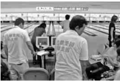
皆さん楽しんでます