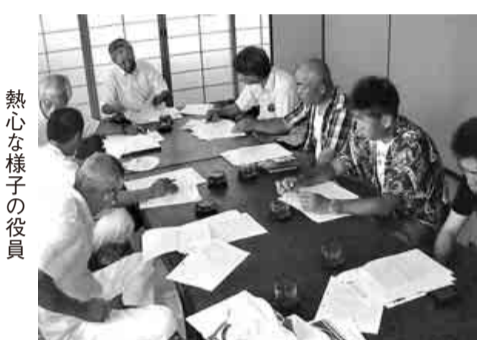
熱心な様子の役員