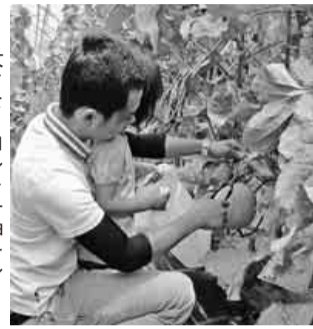
大きなメロンをチョキーン

バス三台に総勢百十五名が分乗し、静岡県掛川方面に向かいました。途中、バスのガラスが濡れていたため、曇り空になりましたが、曇り空のした