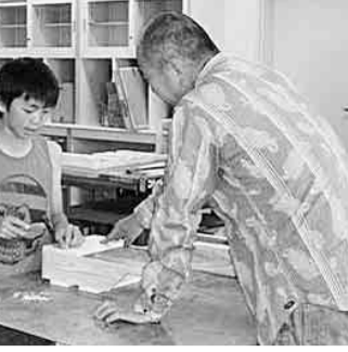
真剣な眼差しで作業する男の子

五月二十七日(日)、午前八時四十五分に味岡市民センターに役員八名が集合し、午前九時の開館に合わせ