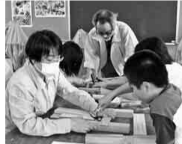
優しく指導する講師(中)

お誘いのお電話をしましたが、参加された方は七名でした。作業中、皆さんは何も言わず真剣な顔して一生懸命にブローチを作っていました。出来上がると、皆さんの笑顔がとても嬉しそうでした。限られた時間もあ