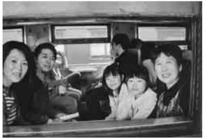
車窓から景色を眺め、出発進行