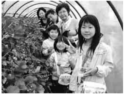
イチゴ美味しいよ

五月十三日(日)風薫る晴天の中、守山支部は大井川SLの旅に出掛けました。今年には全建愛知四十周年の節目にあたり、我々の組合の成り立ちをわかりやすく解説したピアノを借り、ピンゴゲームを借り、間に最初の目的地グリーンピア牧之原に到着。新茶を試飲し、支部より