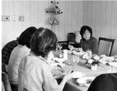
美味しいランチを堪能

六月四日(月)、千種支部主婦の会主催の可愛い小物づくり(ブローチ)教室を田代学区消防団詰所にて開催しました。事前に皆さんに