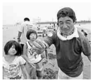
前回開催したマテ貝採り

中建国保では、被保険者の健康を願い、保健事業として保養施設の利用に補助を行っています。 余暇を利用して、心身のリフレッシュにご利用ください。 補助の対象者は、保養施設に宿泊した日において、中建国保の被保険者資格があれば補助を受けられます。(但し、宿泊料金が無料の場合は補助の対象者から除きます) 補助金は、一人当たり一回につき三万円。年度内一回補助が受けられます。(平成二十四年四月一日～平成二十五年三月三十一日までの宿泊に適用) ① 施設を利用する場合は、ご希望の施設に直接お申し込みください。 ※保養施設は、「中建国保の便利帳」平成二十四年度版に「一覧掲載」 ② 便利帳の「保養施設利用者補助金申請書」にフロントで宿泊証明をもらってください。 ③ 「申請書」を組合へ提出 設に宿泊した日において、中建国保の被保険者資格があれば補助を受けられます。(但し、宿泊料金が無料の場合は補助の対象者から除きます) 補助金は、一人当たり一回につき三万円。年度内一回補助が受けられます。(平成二十四年四月一日～平成二十五年三月三十一日までの宿泊に適用) ① 施設を利用する場合は、ご希望の施設に直接お申し込みください。 ※保養施設は、「中建国保の便利帳」平成二十四年度版に「一覧掲載」 ② 便利帳の「保養施設利用者補助金申請書」にフロントで宿泊証明をもらってください。 ③ 「申請書」を組合へ提出 設に宿泊した日において、中建国保の被保険者資格があれば補助を受けられます。(但し、宿泊料金が無料の場合は補助の対象者から除きます) 補助金は、一人当たり一回につき三万円。年度内一回補助が受けられます。(平成二十四年四月一日～平成二十五年三月三十一日までの宿泊に適用) ① 施設を利用する場合は、ご希望の施設に直接お申し込みください。 ※保養施設は、「中建国保の便利帳」平成二十四年度版に「一覧掲載」 ② 便利帳の「保養施設利用者補助金申請書」にフロントで宿泊証明をもらってください。 ③ 「申請書」を組合へ提出