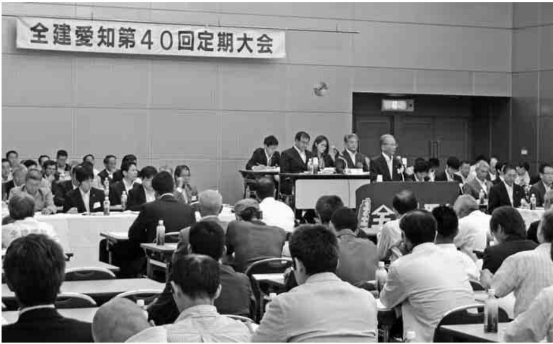
三百七十七名の方々が集まった、 全建愛知第四十回定期大会

この一年の主な活動・第 三十九期決算報告・会計監 査報告を行い、承認されま した。