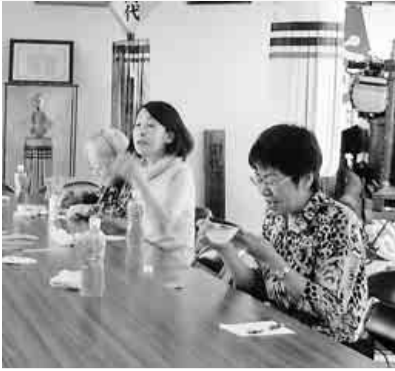
熱心に作業しています

六月四日(月)、千種支部主婦の会主催の可愛い小物づくり(ブローチ)教室を田代学区消防団詰所にて開催しました。事前に皆さんに