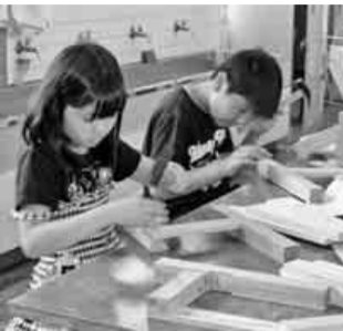
上手に金づちを使っています

海部支部/住宅デー(木工教室) 子供と楽しい時間を過ごせた 六月三日(日)、あま市立正則小学校で親子ふれあい教室が開催されました。海部支部の役員二名が講師となり、問伐材を使ったミニ椅子作りを行いました。二十三日