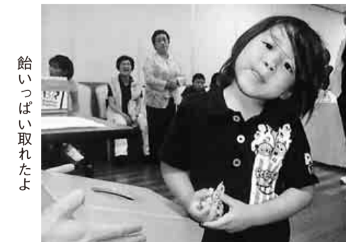
拾いっばい取れたよ

五月二十七日(日)晴天に恵まれた中、名東支部は毎年恒例の青年部主催のボウリング大会が星ヶ丘ボウリングで行いました。参加者三十八名で午前十時三十分彦山青年部長の始球式でゲームスタート