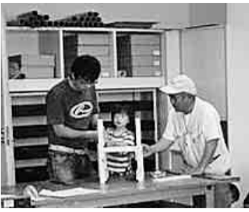
親子に優しく指導する役員(右)

五月二十七日(日)、午前八時四十五分に味岡市民センターに役員八名が集合し、午前九時の開館に合わせ