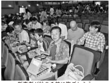
新喜劇が始まる前に腹ごしらえ

お料理をいただきながら、世間話に花を咲かせ心もお腹も一杯になりました。小物づくりをしている顔とは、まったく別の顔でした。今日は、本当に楽しい一日でした。 【山下一枝 記】