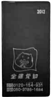
全建愛知組合員手帳

「全建愛知組合員手帳」または全建愛知が発行する「優待券」をフロントに提示すると、割引料金にて「猿投温泉ホテル金泉閣」施設を利用できます。 平成24年4月1日より、「全建愛知組合員手帳」を提示する場合、岩風呂の割引料金が下記のとおり変更となります。(他の割引制度との重複利用はできません)