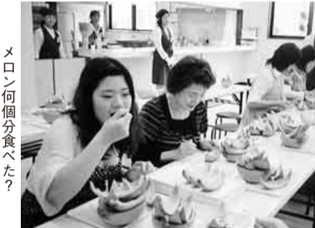
メロン何個分食べた?

六月十日(日)待ちに待った岡崎支部恒例の日帰り旅行がやって来ました。今回は「なんばグランド花月・吉本新喜劇」の旅です。人気のあまり参加出来なかった方も数十名いた中、幸運な四十五名は、梅雨晴れ間の最高の天気にも恵まれ、バスに揺られ大阪へと