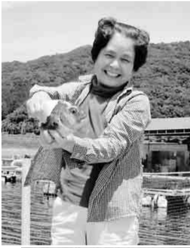
紅一点アングラー

久能山東照宮を参拝。そして、最後はイチゴ狩り。石垣を利用する事により、より美味しくなったイチゴをたっぷり食べて再び満腹。とても充実した一日でした。皆さん、お疲れ様でした。【北原康博通信員】