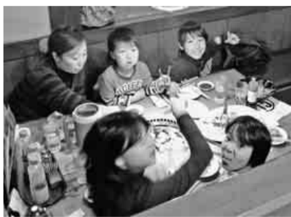
体を動かした後のゴハンは格別

「万が一のために」という言葉は、誰もが耳にしたことがあると思います。しかし、いざという時にどう対処すればいいかわからないという方も多いのではないでしょうか。岡崎支部では、このような緊急事態に備えるため、救命救急講習を開催しました。今回は、岡崎消防署の指導のもと、心肺蘇生法やAEDの使用法について学びました。講習は、まず声に出して一つづつ確認し、何度も繰り返して練習しました。見本をみるのとは違い、実際にやってみると、意外に難しく、また「胸部圧迫(心臓マッサージ)