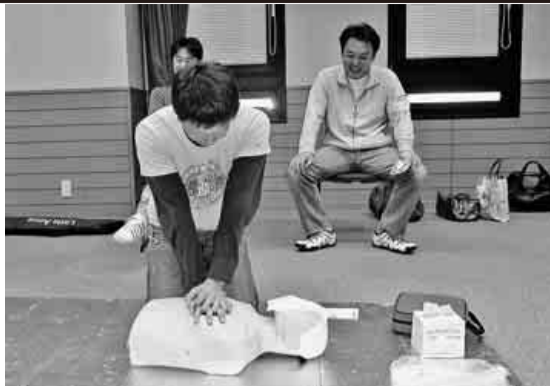
心臓マッサージと人工呼吸

この流れを人形を使ってわかりやすく説明して頂きましたが、初めて使うAEDに少し緊張して何を言えはいいか、何をやるのかわからなくなり苦笑いし