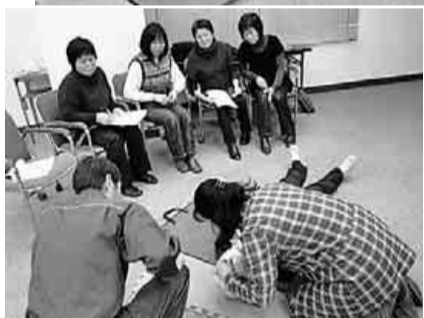
皆さん真剣に取り組んでいます

一月二十九日(日)岡崎消防署にて「救命救急講習」が開催されました。今回は、岡崎支部の役員と主婦の会の合同で、参加者十五名の学習会となりました。