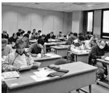
熱心に講義を受ける受講者

この講習会を受け、私もできる自信が付き、喉に餅など詰まらせたときの応急手当や、大出血時の止血法を学んだことで、前よりは落ち着いて行動できる