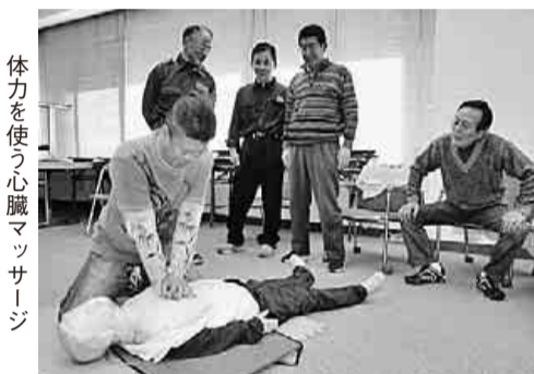
体力を使う心臓マッサージ

一月二十九日(日)岡崎消防署にて「救命救急講習」が開催されました。今回は、岡崎支部の役員と主婦の会の合同で、参加者十五名の学習会となりました。