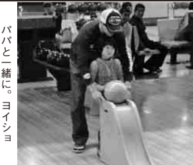
パパと一緒に。ヨイショ