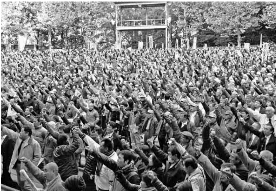
昨年11月22日、全国から5,204名の仲間が集結した中央総決起大会