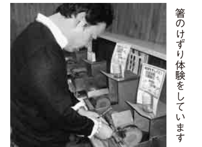
箸のけずり体験をしています

十一月二十七日(日)中支部は四十一名で、日本海小浜へかきを食べに行きました。当日は天気も良くバス旅行は、何度行っても楽しいのか、皆さんの顔から笑みがこぼれていました。最初に着いた小牧かまぼこでは、早くもお土産を買って帰る様です。次は今日一番の楽しみ、かに料理です。