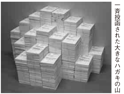
一斉投函された大きなハガキの山

設国保は現行補助水準を確保する見通しとなりまし。但し、個別の国保組合ごとに見ると普通調整補助金は、前回の所得調査を反映したものに二〇一一年度から変更されています。 私たちは全国の仲間と家族によるハガキ要請行動(一月十二日現在、全国で百二十三万七千二百八十一