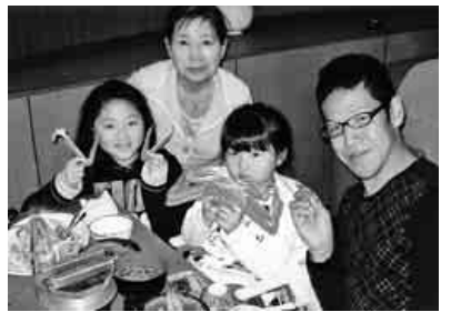
大きな、かにとチーズ

てきて敦賀インターを出た頃には、まさかの降雨。最初の目的地三方五湖の遊覧船の乗り場に到着、残念ながら雨降りの五湖巡り遊覧になつてしまいました。雨降りの遊覧を満喫？遊覧も終りメインの風食会場のホテルへ向かいました。五分位で到着、大広間には蟹料理がずらりと並び皆さん席に着くとすぐに蟹と戦闘開始、