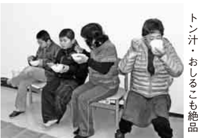
トン汁・おしるこも絶品

十二月十八日(日)、市内東部の神屋公民館にて、久しぶりの餅つきを行いました。北風の吹く曇天のためか、あまり多くの参加者は見られませんでした。