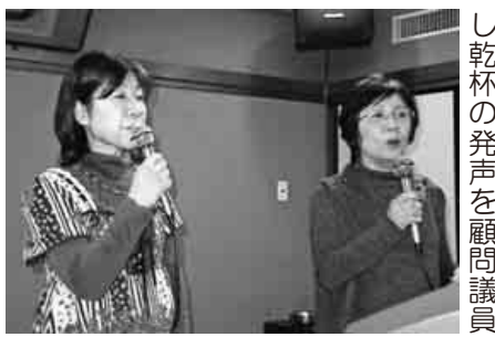
カラオケも楽しそう