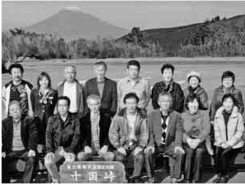
役員研修旅行にて

東日本大震災発生からもうすぐ一年が経とうとしていますが支部の皆様には、支援金にご協力頂き有難うございました。