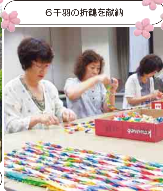
6千羽の折鶴を献納