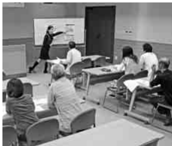
税金講習会の模様

帳簿の整理など確定申告等の準備は順調にすすんでいますか。 確定申告や年末調整に向けて、税金学習デーを開催いたします。