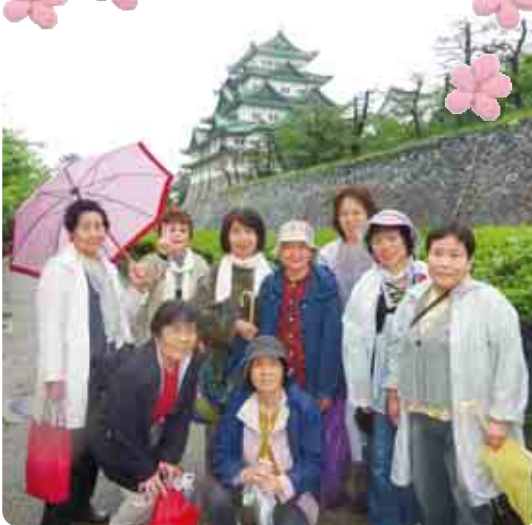
名古屋城にて小雨の中 ウォーキングを行いました