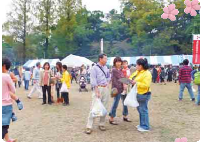
県下3ヶ所でアンケートを実施し組織拡大行動に 取り組みました