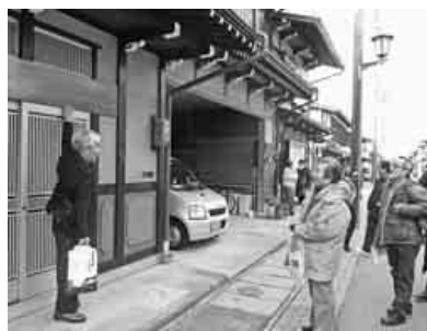
飛騨古川の町並み見学

技術対策部主催の技術研修会を開催します。 今回は、「兵庫県／姫路城大天守修理見学施設『天空の白鷺』」を見学します。 国宝であり世界遺産にも登録されている姫路城、「昭和の大修理」から四十五年が経過し、漆喰や木材の劣化が進んだため、大天守の白漆喰の塗り替え・瓦の葺き替え・耐震補強を重点とした補修工事が行われています。