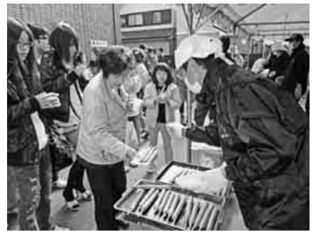
大人気のフランクフルト

百八十個程のチョコいちごは、アツという間になくなるほどの盛況振りでした。主婦の会からは、ふれあ