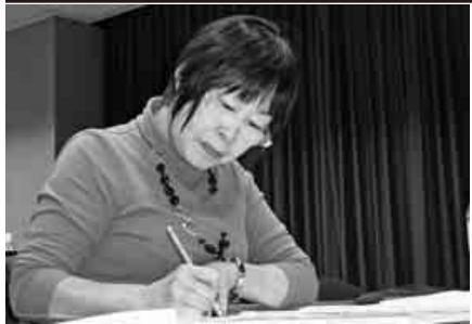
取材記事をまとめる支部通信員

教育宣伝部の活動の中に、支部通信員会議があります。各支部から選出されている支部通信員同士の交流と、機関紙キャロットに掲載する記事の書き方や取材の仕方等の学習の場として、一年に一回、名古屋市内周辺の各所で開催してきましたが、今期より出席回数四回未満の方を対象