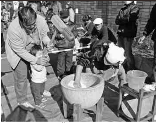
餅つき以外にも青年部の出し物として、スーパーボールすくい・射的・アニメ映画上映会、主婦の会からベタには、慈善バザー・小物作り教室(ブローチ作り)・豚汁、盛りだくさんの催しが行われ、ちびっ子からお年寄りの方まで多く