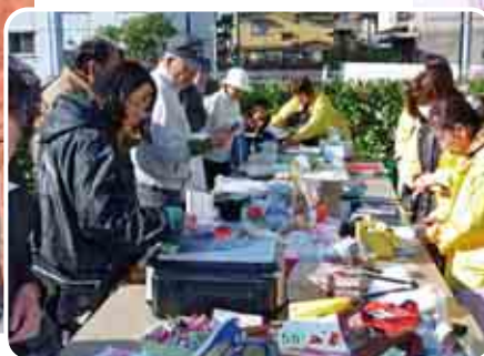
チャリティーバザー お目あての掘り出し物見つかったかな