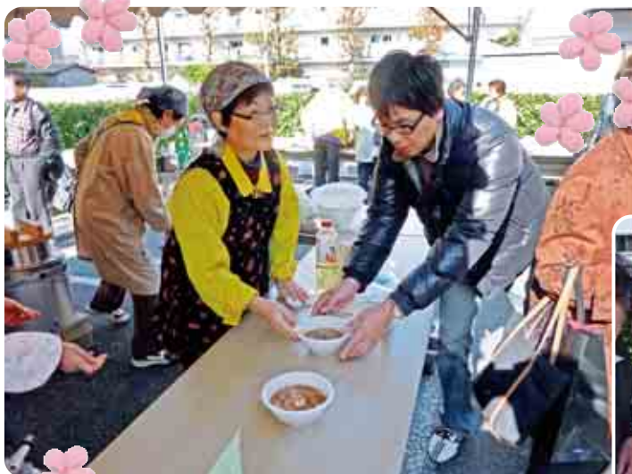
豚汁でほんわか幸せ