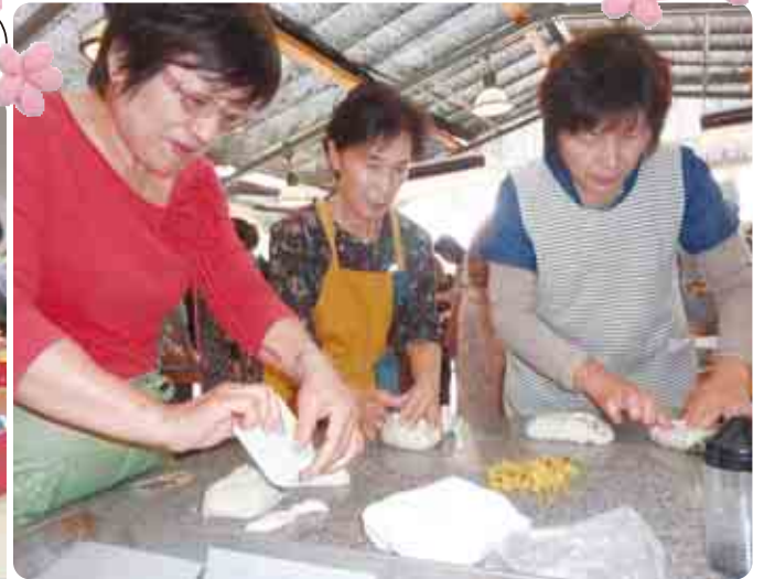
モクモクファームで米粉パンに挑戦