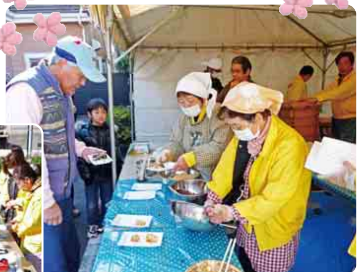
お好みはあんこ・きな粉・からみ餅？