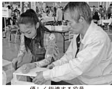
優しく指導する役員

今年「スライド式本立て」を行いました。用意した材料が、二日間とも予約で一杯になるほどの盛況で、役員は開場とともに子どもたちへの作成指導に大忙しでしたが、た