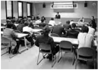
昨年の総会の様子