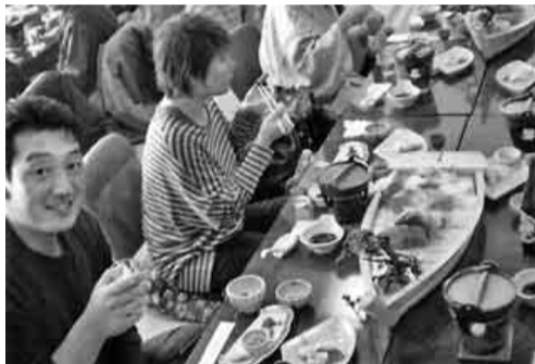
とらふぐ最高ですよ

中村支部壮年部の親睦を深めるための篠島日帰り旅行が行われました。二月二十七日(日)、中村区各地へ集まった参加者二十八名を乗せたバスは知多半島へと出発しました。