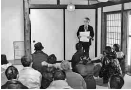
飛騨の匠文化館にて講義の様子

二月二十日(日)毎年恒例の技術対策部主催の技術研修会を行いました。 目的は、岐阜県高山/桜山八幡宮・飛騨の匠文化館・飛騨古川町並みへ、参加人数四十四名で見学に行ってきました。 午前中は飛騨の匠文化館に行き、講師として飛騨古川建築組合連合会事務局長