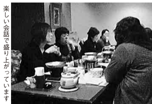
楽しい会話で盛り上がっています

節分もすぎ春の気配も感じられる2月19日(土)北支部主婦の会の集いを、木曽路/黒川店で参加者15名にて催しました。