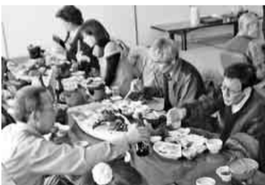
お酒もすすみます