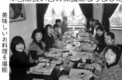
美味しいお料理を堪能

どれを食べても、みんな美味しい美味しいの連発で2日遅れのひな祭りを13名のおひな様(?)で祝い、今年の主婦の会の行事を相談や話し合い、楽しい一時を過ごしました。 【福島秋代 記】