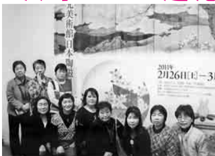
ポストン美術館にて

春爛漫どころか三寒四温の日々の中、私たち美女軍団13名は、3月5日(土)ポストン美術館へ「響きあう うつわ」日本陶磁コレクションを鑑賞してきました。