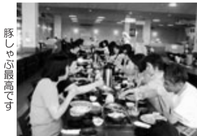
豚しゃぶ最高です

バスの中では抽選会があり、当たった人、他の人にもお土産をいただき、「楽しかったね。また行きたい」と、声をもらい、荷物を両手に持ち、長いバスの道中、笑いの絶えない1日でした。【小田真澄 記】