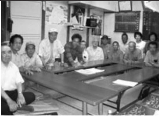
千種・東支部役員の方々と