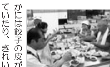
美味しくいただいています

の方々が、五つのグループに分かれて、栄養士の先生の指導のもとそれぞれ料理に挑戦しました。メニューは、焼き餃子、水餃子などいろいろで、七品目ほどありました。