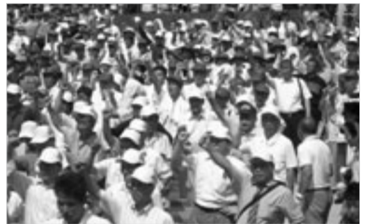
全国、50県連・組合から7,379名参加

全建愛知一宮支部は全建総連7・11中央総決起大会に三十二名で参加しました。 名古屋を午前十時十分の新幹線で東京へ向け出発、十二時三十分会場の日比谷公園大音楽堂に到着しました。 大会会場に入ると、既に全国からの仲間が集まっており、会場は満席。