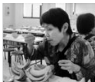
甘くて美味しいメロン、ペロリ

係員から、説明を聞き、さあメロン狩りです。形の良い網目の綺麗なメロンはどれかな、一人一個お土産でいただきました。その後、メロンの食べ放題へ。半分のメロンをスプーンで、すくって