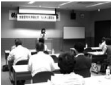
力の入った講習をする講師

中村支部主婦の会 日程 九月一日(月) 午前九時二十分、名駅西口(新幹線側)・旧壁画前に集合してください。