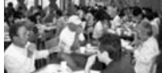
別腹のランチバイキング

いよいよ、さくらんぼ狩りの始まりです。時間も丁度お昼時とあって、皆さん美味しそうにさくらんぼを頬張っていました。さくらんぼでお腹一杯になって次は、ランチバイキング。さくらんぼでお腹一杯になって、すぐにランチは大丈夫かな、と思っていましたが、さくらんぼとランチは別腹？皆さんランチバイキングをしっかりと楽しんでました。