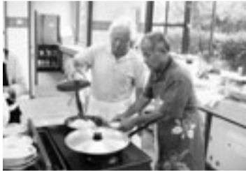
慣れない手つきながらも頑張っています

の方々が、五つのグループに分かれて、栄養士の先生の指導のもとそれぞれ料理に挑戦しました。メニューは、焼き餃子、水餃子などいろいろで、七品目ほどありました。