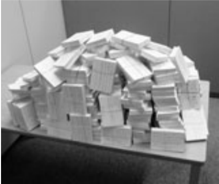
たくさんのハガキが集まりました

国保予算要求に向けたハガキ要請行動を、組合員とご家族の皆さんにお願いいたしましたところ、七月七日現在、二万四千六十九枚のハガキが集まりました。 手書きによるハガキの一字一文字には、「何としても、建設国