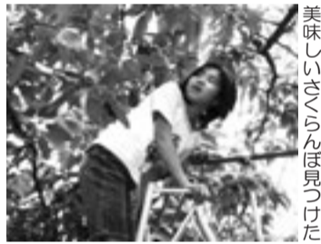
美味しいさくらんぼ見つけた

6月15日(日)一宮支部では支部レクを開催しました。梅雨入りして2週間、雨も心配されましたが、薄曇りの中、一宮尾西庁舎を7時15分にバスは出発。今回の行く先は、「信州さくらんぼ狩り&ハケ岳ランチバイキング」です。参加者92名が2台のバスに分乗、さくらんぼ目指し一路信州へ。バスは、中央道を須玉ICで降り、さくらんぼ農園に11時30分着。