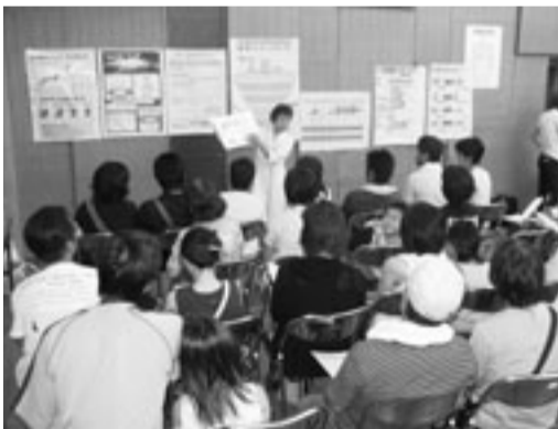
食生活指導を受ける組合員

集団健康診断では、健康づくり教室では、健康づくり教室に参りました。 この日、愛知県スポーツ会館では、百三十七名の方が集団健康診断を受診し、また百二十四名の方が健康づくり教室に参加し、食生活の指導を受けました。 両会場共に、昨年の六割増の受診者と参加者となりました。