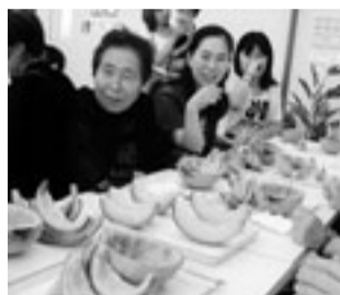
会話も弾んでいます

係員から、説明を聞き、さあメロン狩りです。形の良い網目の綺麗なメロンはどれかな、一人一個お土産でいただきました。その後、メロンの食べ放題へ。半分のメロンをスプーンで、すくって