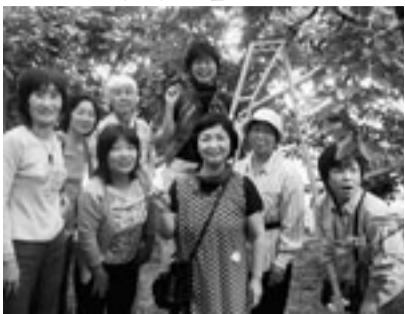
美味しいさくらんぼ見つけた